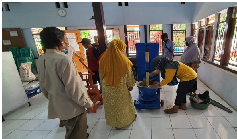
Gambar 5. Monitoring ke tempat produksi opak ketan