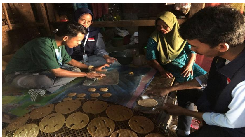
Gambar 2. Tim melakukan observasi awal