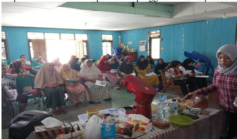
Gambar 3. Kegiatan pelatihan berupa workshop tentang inovasi, pengemasan produk dan pemasaran