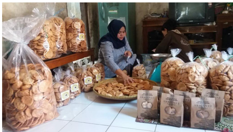
Gambar 4. Opak ketan siap didistribusikan ke toko oleh-oleh dan pusat wisata