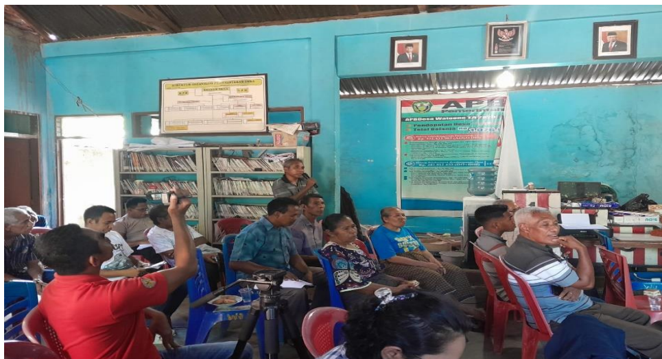
Gambar 3. Proses Diskusi dan Dialog antar Peserta dan Narasumber

Berdasarkan keterangan dari para peserta diskusi diketahui bahwa selama ini pemerintah desa kurang responsif terhadap aspirasi masyarakat sehingga tak sedikit ide-ide atau gagasan cerdas dalam membangun desa tidak terserap kedalam program dan anggaran desa. Hal itu terbukti dari minimnya gagasan membuat program-program inovatif yang bertumpu pada sumber daya alam, seperti pendirian BUMDes untuk mengolah potensi sumber daya alam dan perbaikan pelayanan berbasis digital serta program pemberdayaan kelompok tani dan perempuan yang selama ini berjuang sendiri memenuhi kebutuhan hidupnya. Menurut beberapa peserta diskusi, pemerintah desa selain tidak responsif tetapi juga tidak transparan dan partisipatif dalam merancang program pembangunan dan anggaran desa. Misalnya kegagalan pemerintah desa dalam melaksanakan program pemboran air yang telah menelan dana desa ratusan juta rupiah tetapi tidak memberi manfaat apa-apa bagi masyarakat desa. Karena itu diakhir diskusi semua peserta menghendaki dibangunnya suatu kesepakatan bersama antara pemerintah desa dan BPD supaya ke depan pemerintah desa mesti lebih bertanggung jawab pada masyarakatnya melalui penyerapan aspirasi agar dapat membuat program-program yang lebih bertumpu pada kebutuhan dan kekuatan sumber daya alam setempat, transparan dan memastikan program-program pembangunan yang digulirkan menyentuh kepentingan masyarakat.