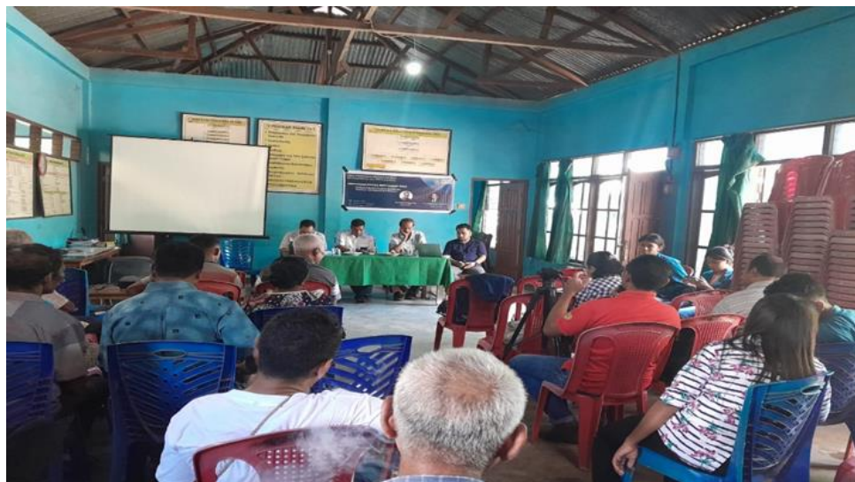
Gambar 2. Proses penyampaian materi pelatihan

Dalam sesi dialog dan diskusi tentang proses pendirian BUMDes dan penentuan jenis usaha diketahui bahwa sesungguhnya mayoritas peserta dan warga desa sangat membutuhkan dan menyetujui kehadiran BUMDes sebagai wadah untuk mengembangkan ekonomi lokal. Karena mayoritas peserta setelah mendapatkan informasi mendalam tentang proses pendirian BUMDes telah meyakini bahwa BUMDes di desa Watoone dapat menjadi penggerak utama dalam pengembangan ekonomi lokal dan masyarakat desa dapat mengembangkan usaha dan proyek ekonomi yang berkelanjutan. Dengan demikian menurut peserta, BUMDes dapat menciptakan lapangan kerja baru, meningkatkan pendapatan masyarakat dan mengurangi ketergantungan pada sektor ekonomi yang tidak stabil seperti pertanian atau perikanan. Selain itu pendirian BUMDes memberikan kesempatan kepada masyarakat untuk berpartisipasi secara aktif dalam pengambilan keputusan dan pengelolaan usaha.