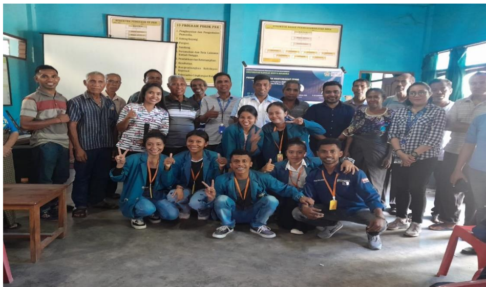
Gambar 4. Foto bersama Mitra Kegiatan Pelatihan

Di penghujung pertemuan, para peserta FGD senada suara bersepakat akan mendesak BPD dan pemerintah desa supaya segera mempersiapkan segala sesuatu yang berkaitan dengan proses pendirian BUMDes di tahun 2023. Untuk itu bagi pemateri langkah awal yang harus segera ditindaklanjuti adalah mempersiapkan sebuah tim desa yang terdiri dari pemerintah desa, BPD dan tokoh masyarakat untuk melaksanakan segera melakukan kegiatan sosialisasi tentang proses pendirian BUMDes agar dapat diketahui tujuan dan manfaatnya dan memastikan informasinya tersebar luas ke semua lapisan masyarakat desa baik di level RT maupun Dusun. Hal ini penting dilakukan agar proses pendirian BUMDes benar-benar sesuai dengan prosedur yang benar dan diketahui serta dipahami manfaatnya secara baik dan disetujui oleh mayoritas masyarakat desa agar kelak tidak menimbulkan resistensi di desa.