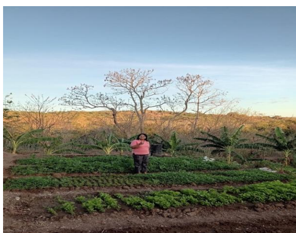
Gambar 2. Kebun sayur Bersama

Hasil yang diperoleh dari kegiatan ini adalah adanya peningkatan pengetahuan yang dimiliki oleh mitra sebelum dan sesudah diberikan penyuluhan. Untuk lebih jelasnya dapat dilihat pada tabel 1, dibawah ini.