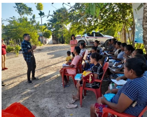
Gambar 1. Kegiatan penyuluhan

Kegiatan penyuluhan gizi dan pemberdayaan masyarakat berupa pendidikan, pelatihan dan penanaman sayur berjalan dengan lancar. Peserta penyuluhan terdiri dari ibu hamil, ibu menyusui dan ibu rumah tangga sementara untuk kegiatan pendidikan, pelatihan dan penanaman sayur juga diikuti oleh pasangan dari ibu-ibu yang terlibat dalam kegiatan penyuluhan yang dilakukan sebelumnya. Dalam kegiatan ini peserta cukup antusias dalam menerima materi yang disampaikan, termasuk juga aktif dalam kegiatan penanaman sayur untuk kebun keluarga.