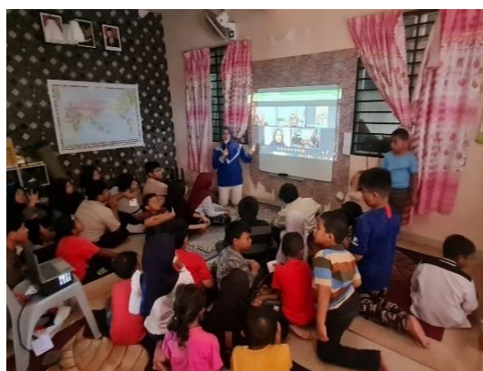
Gambar 4. Pengelolaan kebersihan SB

Sesi tiga: Pengelolaan kebersihan SB dapat dilihat pada Gambar 4. Pengelolaan kebersihan di SB dapat menunjang dan meningkatkan sikap peduli terhadap lingkungan yang dimiliki peserta didik. Sikap peduli lingkungan adalah sikap dan tindakan untuk mencegah terjadinya kerusakan pada lingkungan alam dan sekitarnya, serta upaya untuk memperbaiki setiap kerusakan-kerusakan yang sudah ada (Ismail, 2021). Karakter peduli terhadap lingkungan yang dimiliki merupakan sikap untuk mengelola, menjaga, memperbaiki, dan melestarikan lingkungan (Haul dkk., 2021). Hasil dari sesi ini adalah peserta didik memiliki kesadaran dan kepedulian untuk mengelola kebersihan sekolahnya (SB) dan dapat melakukan pengelolaan kebersihannya.