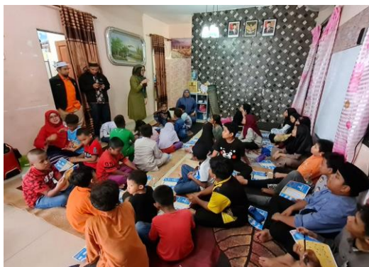
Gambar 5. Pembuatan poster-poster terkait kesehatan lingkungan

Sesi lima: Pelatihan trauma healing melalui permainan cerita anak dapat dilihat pada Gambar 6. Kegiatan trauma healing termasuk dalam kegiatan pengabdian kepada masyarakat yang memiliki tujuan penanganan permasalahan psikologis yang dialami mulai dari stres, rasa takut, dan trauma pasca bencana (Salamor dkk., 2020). Play therapy yang diterapkan pada anak-anak dapat mengalihkan fokusnya dari situasi-situasi yang dirasa mencekam dan mengkhawatirkan (Salamor dkk., 2020). Salah satu penerapan permainan tersebut adalah dengan membawakan cerita-cerita anak. Kegiatan mendongeng yang diberikan bukan hanya sebagai hiburan, akan tetapi dapat memberikan suatu manfaat bagi pendongeng dan pendengar dengan meningkatkan kemampuan berkomunikasi dan kemampuan mendengarkan (Purnamasari dkk., 2023). Hasil dari sesi ini adalah peserta didik merasa rileks, lebih tenang, dapat bercerita secara terbuka, dapat berteriak dan bernyanyi bersama sebagai bentuk luapan emosinya.