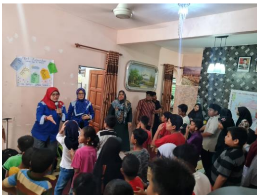
Gambar 3. Sosialisasi pengelolaan sampah organik dan anorganik

Sesi tiga: Pengelolaan kebersihan SB dapat dilihat pada Gambar 4. Pengelolaan kebersihan di SB dapat menunjang dan meningkatkan sikap peduli terhadap lingkungan yang dimiliki peserta didik. Sikap peduli lingkungan adalah sikap dan tindakan untuk mencegah terjadinya kerusakan pada lingkungan alam dan sekitarnya, serta upaya untuk memperbaiki setiap kerusakan-kerusakan yang sudah ada (Ismail, 2021). Karakter peduli terhadap lingkungan yang dimiliki merupakan sikap untuk mengelola, menjaga, memperbaiki, dan melestarikan lingkungan (Haul dkk., 2021). Hasil dari sesi ini adalah peserta didik memiliki kesadaran dan kepedulian untuk mengelola kebersihan sekolahnya (SB) dan dapat melakukan pengelolaan kebersihannya.