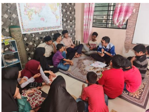
Gambar 6. Pelatihan trauma healing melalui permainan cerita anak

Sesi lima: Pelatihan trauma healing melalui permainan cerita anak dapat dilihat pada Gambar 6. Kegiatan trauma healing termasuk dalam kegiatan pengabdian kepada masyarakat yang memiliki tujuan penanganan permasalahan psikologis yang dialami mulai dari stres, rasa takut, dan trauma pasca bencana (Salamor dkk., 2020). Play therapy yang diterapkan pada anak-anak dapat mengalihkan fokusnya dari situasi-situasi yang dirasa mencekam dan mengkhawatirkan (Salamor dkk., 2020). Salah satu penerapan permainan tersebut adalah dengan membawakan cerita-cerita anak. Kegiatan mendongeng yang diberikan bukan hanya sebagai hiburan, akan tetapi dapat memberikan suatu manfaat bagi pendongeng dan pendengar dengan meningkatkan kemampuan berkomunikasi dan kemampuan mendengarkan (Purnamasari dkk., 2023). Hasil dari sesi ini adalah peserta didik merasa rileks, lebih tenang, dapat bercerita secara terbuka, dapat berteriak dan bernyanyi bersama sebagai bentuk luapan emosinya.