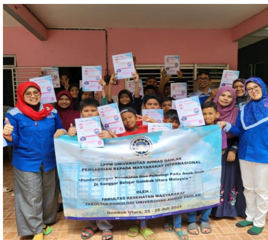
Gambar 7. Pelatihan penanganan stres

Sesi tujuh: Serah terima alat. Pada sesi ini diberikan berupa LCD dan Proyektor untuk proses pembelajaran. LCD proyektor sebagai pendukung pembelajaran mampu meningkatkan motivasi belajar yang dimiliki peserta didik, karena adanya tampilan materi yang menarik dan dapat menampilkan objek secara visual dan gerak ditambah audio visual gerak (Eliyantika dkk., 2022). Penggunaan LCD proyektor dapat memberikan manfaat kepada peserta didik dengan penyampaian materi yang lengkap, sistematis, dan mendetail, sehingga peserta didik mampu memahami materi yang disampaikan dengan baik (Maryono dkk., 2022). Hasil dari sesi ini adalah SB mendapatkan media/alat pembelajaran untuk mempermudah proses penyampaian materi, mempermudah proses belajar mengajar, dan meningkatkan prestasi belajar anak didiknya berupa LCD dan layar LCD.