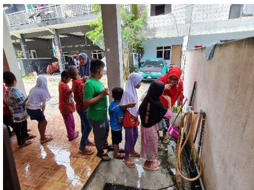
Gambar 2. Pelatihan dan praktik tentang pengelolaan hygiene sanitasi personal dan kesehatan lingkungan

Sesi satu: Pelatihan dan praktik tentang pengelolaan hygiene sanitasi personal dan kesehatan lingkungan yang dilaksanakan dengan memberikan edukasi dan simulasi dapat dilihat pada Gambar 2. Edukasi dan simulasi yang diberikan pada sesi ini adalah tata cara mandi, gosok gigi, cuci tangan, dan mengelola kebersihan diri bagi peserta didik perempuan yang sudah mengalami menstruasi. Personal hygiene adalah suatu cara untuk merawat kebersihan dan kesehatan individu demi kesejahteraan fisik maupun psikisnya (Isro'in & Andarmoyo, 2018). Personal hygiene dan kesehatan lingkungan memiliki peran penting terkait permasalahan gizi, seringkali menjadi penyebab terkena penyakit infeksi (diare dan ISPA) pada anak (Aridiyah dkk., 2015). Pada sesi ini diharapkan peserta didik mendapatkan peningkatan keberdayaan diri terkait hygiene sanitasi personal dan kesehatan lingkungan. Hasilnya adalah peserta didik dapat menjaga kebersihan tubuhnya yang meliputi: kebersihan kulit, gigi, mulut, rambut, mata, hidung, telinga, kaki, dan kuku, serta kebersihan dan kerapian pakainya.