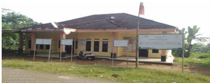
Gambar 3. Profile Desa Pasir Durung Kecamatan Sindangresmi Pandeglang