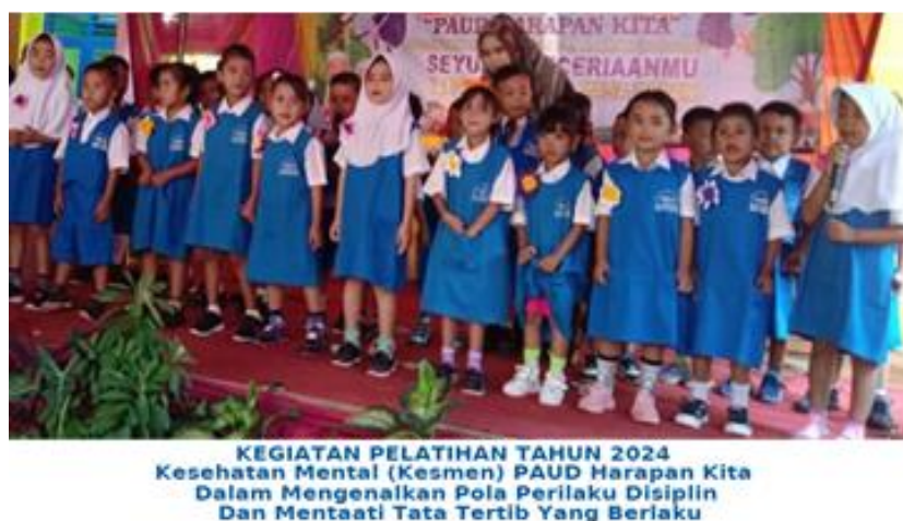
Gambar 4. Pengenalan pola perilaku kesehatan mental PAUD Harapan Kita

Pengenalan pola perilaku dan kesehatan mental merupakan bagian penting dari pemberdayaan guru di PAUD Harapan Kita yang harus membantu guru mengenali, memahami, dan mendukung kebutuhan kesehatan mental. Kegiatannya adalah: 1) Pendidikan dan Pelatihan Dasar, yang melibatkan pemahaman dasar kesehatan mental dan identifikasi pola perilaku. Pemahaman dasar tentang kesehatan mental melibatkan pelatihan dasar bagi guru PAUD Harapan Kita tentang konsep kesehatan mental, termasuk definisi, pentingnya, dan bagaimana kesehatan mental mempengaruhi perkembangan anak-anak. Sementara identifikasi pola perilaku melibatkan pelatihan guru PAUD Harapan Kita untuk mengenali pola perilaku yang normal dan yang mungkin menunjukkan masalah kesehatan mental, termasuk pemahaman berbagai tahap perkembangan emosional dan sosial anak-anak (Wardhani, 2022). Foto kegiatan dapat dilihat pada Gambar 4.