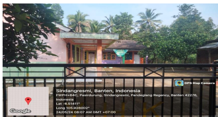
Gambar 1. Lokasi PAUD Harapan Kita

Metode penelitian adalah melakukan pelatihan pemberdayaan dalam pendidikan Kesehatan Mental (Kesmen) bagi guru di PAUD Harapan Kita pada tahun 2024. Pelaksanaan pengabdian kepada Masyarakat dengan melaksanakan pelatihan pemberdayaan bertujuan meningkatkan kompetensi guru agar lebih sehat dan terampil. Sehingga kesehatan mental guru sebagai fondasi pengembangan dimensi sosial, emosional, dan psikologis mereka (Arikunto, 2006). Pelatihan pemberdayaan dilaksanakan sebagai upaya pencegahan dini untuk mengatasi hambatan dalam mencapai proses pembelajaran yang maksimal (Suwarni dkk., 2018). Lokasi pengabdian kepada Masyarakat dilakukan di PAUD Harapan Kita yang ada pada Gambar 1, dengan lokasi di Kampung Pasir Durung RT 02 RW 04, Desa Pasir Durung, Kecamatan Sindangresmi, Kabupaten Pandeglang, 42276, Banten. Google Maps lokasi dapat di akses disini: [ Link Google Maps PAUD Harapan Kita ].