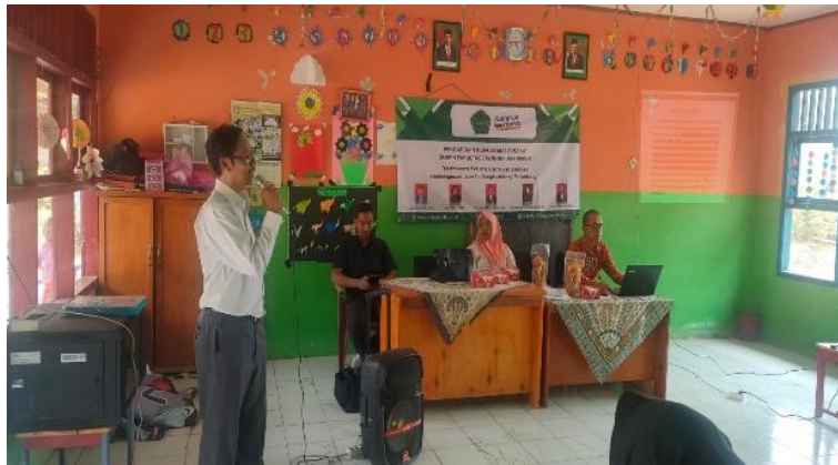
Gambar 3. Kegiatan pelatihan berupa workshop tentang peluang usaha