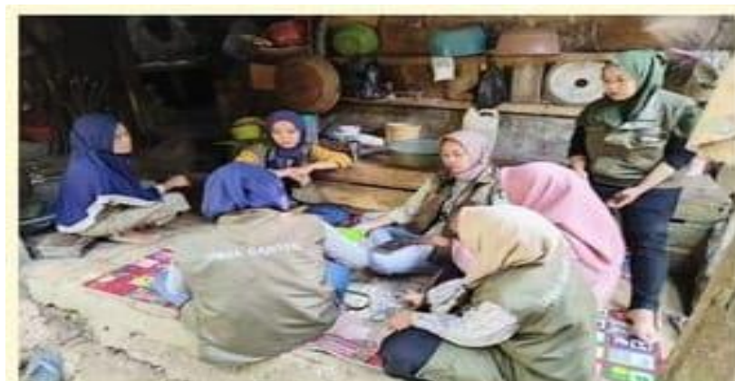
Gambar 4. Pendampingan pembuatan rangging dan pengemasan produk

Pendampingan dilakukan oleh tim kepada peserta bertujuan untuk membantu peserta mencapai tujuan kegiatan PKM yaitu meningkatkan pengetahuan dan keterampilan peserta dalam pembuatan produk serta dapat membuka peluang usaha baru bagi masyarakat desa Kadumalati sehingga masyarakat lebih kreatif dan semangat dalam berwirausaha. Kegiatan ini diharapkan dapat berlanjut dan berkesinambungan, untuk itu partisipasi aktif pemerintah desa dan masyarakat sangat dibutuhkan. Hasil pendampingan bisa dilihat pada gambar 4 berikut ini: