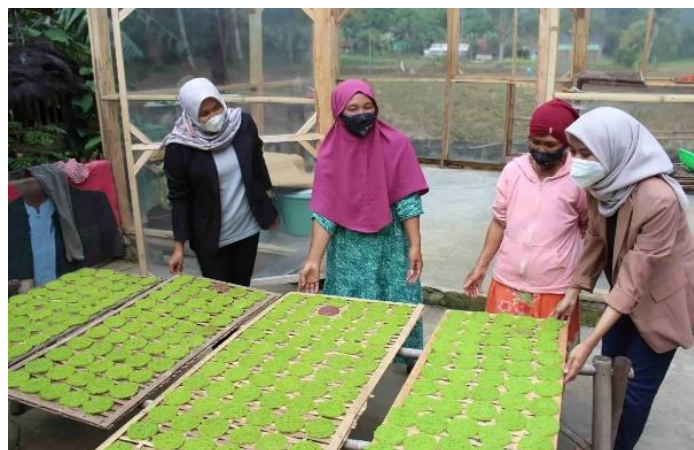
Gambar 1. Observasi potensi desa Kadumalati