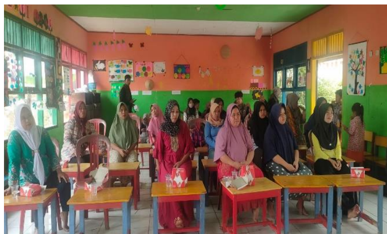
Gambar 2. Sosialisasi kegiatan PKM di desa Kadumalati

Sosialisasi dilakukan untuk memberikan informasi kepada pemerintah desa dan masyarakat tentang kegiatan yang akan dilakukan oleh tim sehingga diharapkan pemerintah desa dan masyarakat dapat memahami dengan baik tahapan pelaksanaan kegiatan dan dapat berperan aktif selama kegiatan ini berlangsung. Tim telah melakukan kegiatan sosialisasi kepada masyarakat yang dihadiri oleh ibu kepala desa dan juga ibu rumah tangga dengan total keseluruhan peserta sebanyak 30 orang. Kegiatan sosialisasi dapat dilihat pada gambar 2 berikut ini: