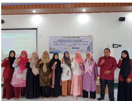
Gambar 4. Foto bersama dengan perwakilan peserta kegiatan

Pada kegiatan pelaksanaan pengabdian para peserta kegiatan berantusias dalam kegiatan terlihat dari keaktifan para peserta dalam sesi tanya jawab dan sesi diskusi, peserta juga aktif dalam kegiatan praktik mempelajari bahasa isyarat baik itu sibi maupun bisindo.