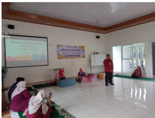
Gambar 2. Pemateri menjelaskan materi tentang coping stress