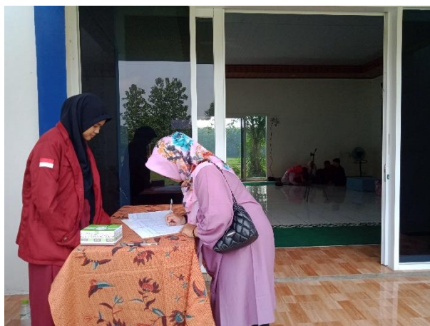
Gambar 1. Absensi sebelum kegiatan pelatihan dimulai

Stres para guru di sekolah akan mempengaruhi proses pembelajaran pada anak yang tidak optimal sehingga berakibat hilangnya kreativitas guru, penurunan kinerja guru, kualitas interaksi dengan siswa yang memburuk juga akan memengaruhi kualitas guru itu sendiri, dan semakin memengaruhi efektivitas Pendidikan (Ferreira & Martinez, 2012; Hughes, 2001) sehingga penting sekali untuk para guru PAUD di sekolah regular yang menangani peserta didik dengan berkebutuhan khusus untuk mampu mengendalikan stres yang dihadapinya saat menangani anak bekebutuhan khusus atau biasa kita sebut dengan strategi coping stress . Hans Selye menggolongkan stres menjadi dua tipe yaitu distress (stress negative) sebagai dan eustress (stress positif) (Wade & Tavris, 2014). Sebelum kegiatan berlangsung para peserta mengisi absensi terlebih dahulu