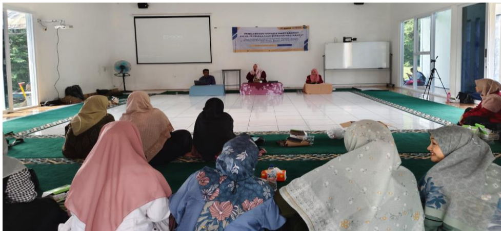
Gambar 3. Kegiatan penyuluhan mitigasi bencana bagi kader Posyandu

Secara keseluruhan, penyuluhan edukatif mengenai mitigasi bencana ini telah berhasil memberdayakan perempuan sebagai kader Posyandu di Kecamatan Kasemen untuk memainkan peran yang lebih besar dalam menjaga keselamatan komunitas mereka. Pengetahuan dan keterampilan yang mereka peroleh selama penyuluhan menjadi fondasi yang kuat untuk menciptakan komunitas yang lebih tangguh dan siap menghadapi berbagai potensi bencana di masa depan. Dengan demikian, diharapkan bahwa upaya mitigasi bencana di Kecamatan Kasemen akan menjadi lebih efektif dan berdampak positif bagi seluruh warga.