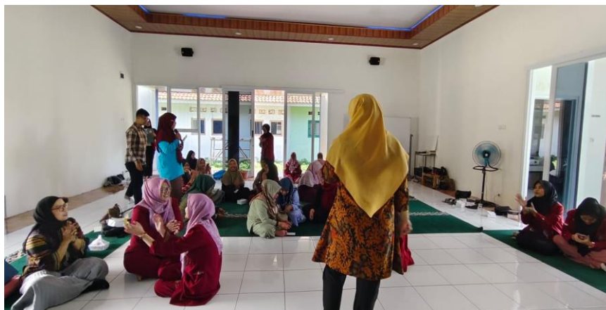
Gambar 4. Kegiatan simulasi mitigasi bencana dengan seluruh kader Posyandu

Pelaksanaan simulasi juga berdampak pada peningkatan kesadaran dan partisipasi masyarakat dalam upaya mitigasi bencana. Masyarakat yang terlibat dalam simulasi ini menjadi lebih sadar akan risiko bencana dan pentingnya kesiapsiagaan. Para kader Posyandu berperan sebagai agen perubahan yang mengedukasi warga tentang langkah-langkah mitigasi yang dapat dilakukan sehari-hari, seperti menyiapkan tas darurat dan memahami rute evakuasi. Dengan demikian, komunitas di Kecamatan Kasemen kini lebih siap dan proaktif dalam menghadapi potensi bencana.