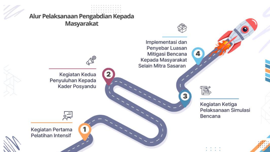
Gambar 1. Alur pelaksanaan pengabdian kepada masyarakat

Kegiatan kedua dilaksanakan pada minggu kedua, berupa penyuluhan kepada kader Posyandu. Penyuluhan ini berlangsung selama satu hari, dengan fokus pada edukasi dengan menggunakan alat bantu seperti poster, video edukasi, dan buku cerita yang ramah anak yang akan di sebarkan luaskan kepada orang tua dan anak-anak mengenai langkah-langkah yang harus diambil sebelum, selama, dan setelah bencana terjadi. Kegiatan ketiga adalah pelaksanaan simulasi bencana pada minggu keempat, di mana simulasi dilakukan selama satu hari dengan menampilkan beberapa bencana yang berbeda. Simulasi ini melibatkan partisipasi aktif dari mitra sebagai peserta, untuk melatih kesiapsiagaan dan respon cepat dalam situasi darurat. Evaluasi dilakukan secara menyeluruh di akhir bulan untuk mengukur peningkatan pengetahuan dan kesiapsiagaan peserta, serta menilai efektivitas program dalam mencapai tujuan mitigasi bencana.