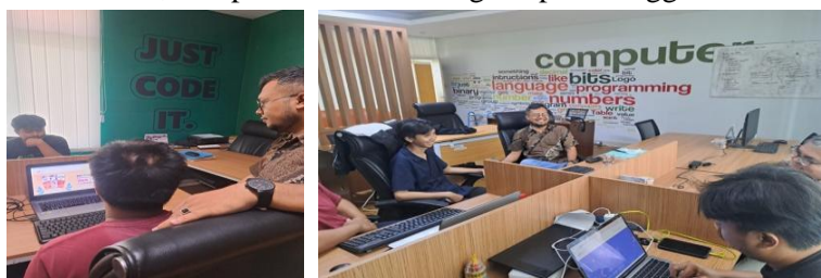
Gambar 2. Diskusi perancangan situs www.kampungliterasi.untirta.ac.id

Situs ini dirancang oleh web developer profesional dengan server yang disimpan di UPA TIK Untirta. Dengan kolaborasi ini, kehadiran situs berbasis konten warga di Kampung Literasi Taman Barang, dapat dikatakan sebagai keberlanjutan ( sustainability ) dari proyek pemberdayaan kawasan sekitar Untirta yang telah dimulai oleh Rektor Untirta dan UPA TIK Untirta. Perancangan menu-menu dan fitur-fitur dari situs www.kampungliterasi.untirta.ac.id dilaksanakan di gedung Pusdainfo lantai 2, kampus Untirta Sindangsari pada tanggal 31 Juli 2024.