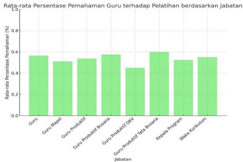
Gambar 6. Persentase pemahaman guru terhadap konten microlearning berdasarkan lama mengajar

Diagram pada gambar 6 mengilustrasikan perbandingan rata-rata persentase pemahaman guru terhadap konten microlearning berdasarkan jabatan mereka. Terlihat bahwa pemahaman tertinggi dimiliki oleh guru produktif tata busana, dengan rata-rata persentase pemahaman mendekati 85%. Hal ini menunjukkan bahwa guru dengan spesialisasi di bidang produktif dan keterampilan praktis lebih terfokus atau memiliki metode pembelajaran yang lebih efektif selama pelatihan. Sementara itu, guru mapel dan guru produktif lainnya juga menunjukkan tingkat pemahaman yang cukup baik, meskipun sedikit lebih rendah dibandingkan dengan guru produktif tata busana. Waka kurikulum dan kepala program memiliki rata-rata pemahaman yang berada di sekitar 50%, menunjukkan perlunya peningkatan atau penyesuaian dalam pelatihan untuk kelompok ini. Secara umum, pemahaman terhadap pelatihan cenderung bervariasi berdasarkan jabatan, dengan guru produktif secara keseluruhan menunjukkan pemahaman yang lebih tinggi dibandingkan dengan guru mata pelajaran dan guru produktif lainnya. Hal ini mungkin disebabkan oleh fokus mereka pada keterampilan praktis yang lebih mudah diintegrasikan dalam pelatihan.