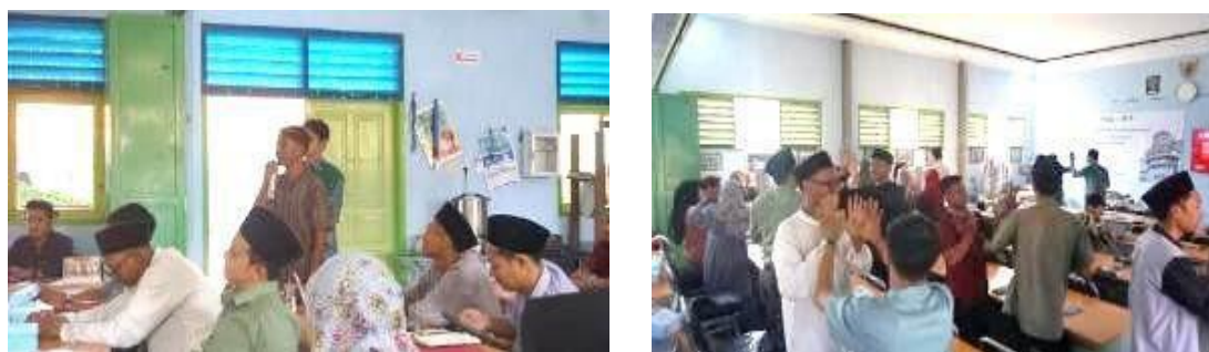
Gambar 3. Sesi praktik dan ice breaking

Tahap terakhir dari program ini adalah evaluasi hasil pelatihan. Evaluasi dilaksanakan dalam dua sesi dengan masing-masing sesi berdurasi dua jam (hari ketiga pelatihan). Dalam sesi ini, para guru diminta untuk mempresentasikan produk microlearning yang telah mereka kembangkan di hadapan rekan-rekan mereka. Proses evaluasi melibatkan diskusi mendalam dan pemberian umpan balik konstruktif dari tim pengabdian serta sesama guru mengenai aspek teknis dan pedagogis dari materi yang dibuat. Guru-guru diberikan kesempatan untuk merevisi dan menyempurnakan konten mereka berdasarkan saran yang diberikan.