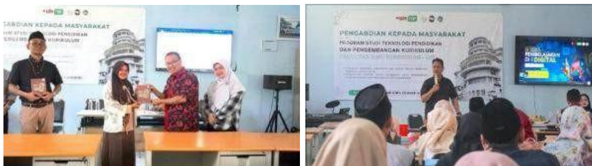
Gambar 2. Pelaksanaan program pelatihan

Berdasarkan kebutuhan yang teridentifikasi, tim pengabdian merancang dan melaksanakan program pelatihan yang komprehensif. Pelatihan ini meliputi pengenalan konsep dasar microlearning dengan teknik pengembangan materi digital seperti video interaktif, infografis, dan slide interaktif. Selain itu, pelatihan ini juga memberikan bimbingan langsung dalam pembuatan konten digital, sehingga guru dapat mempraktekkan apa yang telah mereka pelajari secara langsung.