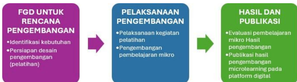
Gambar 1. Metode pelaksanaan pengabdian kepada masyarakat

Kegiatan pengabdian pada masyarakat ini berlangsung di SMK Bina Cendekia Cirebon, di Kabupaten Cirebon. Kegiatan ini melibatkan 42 guru yang ada di SMK Bina Cendekia Cirebon. Metode focus group discussion (FGD) dan pendampingan pengembangan bahan ajar digital digunakan dalam kegiatan ini. FGD dilakukan untuk mengumpulkan informasi terkait identifikasi perbedaan kebutuhan belajar individu dari perspektif pembelajaran yang berbeda dan kemudian mengeksplorasi kompetensi apa saja dalam mengembangkan pembelajaran mikro yang perlu dikembangkan atau ditingkatkan (Akyıldız, 2020). Dengan demikian, pengembangan bahan ajar pembelajaran mikro digital dapat menjadi solusi yang efektif untuk memenuhi kebutuhan belajar siswa. Bahan ajar pembelajaran mikro digital yang telah dikembangkan kemudian diunggah oleh guru pada berbagai platform digital milik guru sehingga pada akhirnya dapat dimanfaatkan oleh banyak orang, tidak hanya oleh siswa tetapi juga oleh masyarakat luas yang relevan. Adapun pelaksanaan program pengabdian kepada masyarakat ini diilustrasikan pada gambar 1.