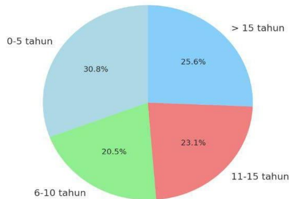
Gambar 5. Persentase pemahaman guru terhadap konten microlearning berdasarkan lama mengajar

Dalam pengabdian ini, tim melakukan pengukuran terhadap kompetensi guru dalam hal pembuatan konten microlearning . Pengukuran dilakukan dengan postest dalam bentuk kuesioner (pilihan ganda) yang diberikan setelah kegiatan berlangsung. Hasil postest berkenaan pemahaman guru terhadap konten digital berdasarkan lama mengajar secara rata-rata menunjukkan persentase di atas 50% sebagaimana yang disajikan pada gambar 5. Sementara penilaian terkait produk yang dihasilkan juga dilakukan melalui rubrik penilaian produk.