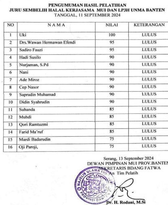
Gambar 5. Hasil evaluasi penilaian pada pelatihan Juru sembelih halal Kabupaten Pandeglang

Hasil post test dari pelatihan juru smebelih halal dinyatakan semua peserta mendapatkan penilaian yang baik (diatas 75) (Gambar 5). Nilai ini menunjukkan peserta pada umumnya memahami prosedur penyembelihan halal sesuai dengan standar yang telah diajarkan oleh para pelatih. Tingkat keberhasilan ini juga menunjukkan peserta mampu menguasai keterampilan dan prinsip-prinsip dasar dalam pelaksanaan tugas mereka sebagai juru sembelih halal. Dengan demikian, ada peluang untuk peningkatan kompetensi sehingga para juru sembelih halal Pandehglang dapat mencapai standar tertinggi dalam pelaksanaan tugasnya sebagai juru sembelih halal.