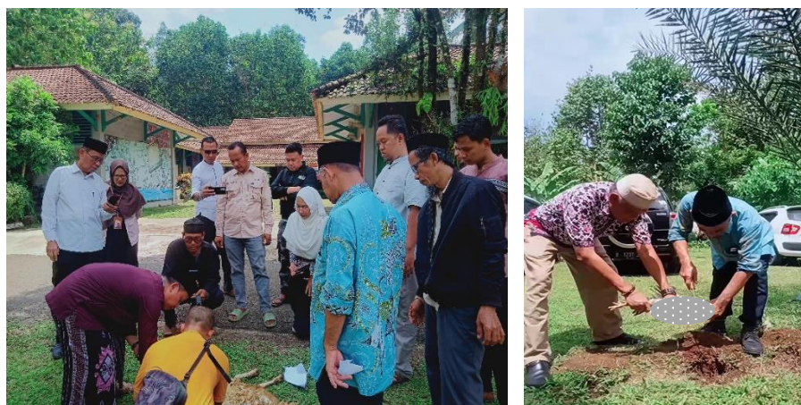
Gambar 4. Praktek penyembelihan oleh juru sembelih halal Kabupaten Pandeglang