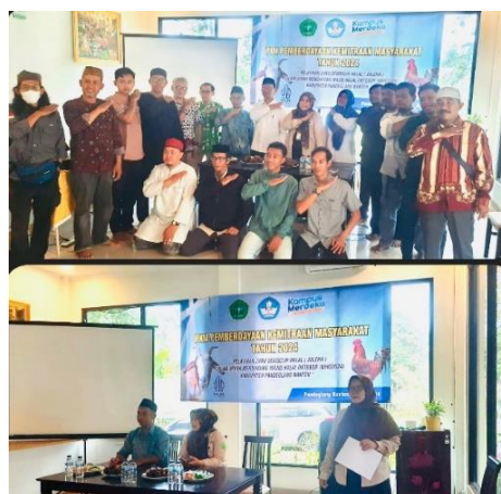
Gambar 3. Pelatihan juru sembelih halal Kabupaten Pandeglang

Kompetensi Kerja Nasional Indonesia (SKKNI) dengan mengikuti prinsip-prinsip dasar penyembelihan hewan secara halal menurut syariat Islam. Dilakukan pemaparan teori berdasarkan SKKNI tersebut dengan teori-teori sebagai berikut, 1) tujuan pelatihan, untuk membekali peserta dengan pengetahuan dan keterampilan untuk melakukan penyembelihan hewan secara halal sesuai dengan standar yang diatur oleh SKKNI dan hukum Islam, 2) garis besar program, pengantar halal dan Haram dalam Hukum Islam, proses penyembelihan halal, kesejahteraan hewan sebelum penyembelihan, teknik penyembelihan sesuai syariat, Kesehatan dan Keselamatan Kerja (K3) dalam penyembelihan, proses sertifikasi, dan pengawasan halal.