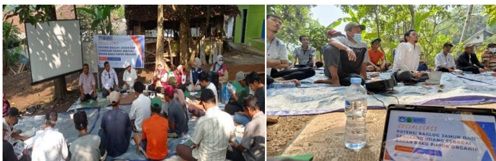
Gambar 3. Sosialisasi potensi limbah baglog jamur dan cangkang udang sebagai bahan baku pupuk organik

Pada kegiatan sosialisasi dijelaskan tinjauan umum tentang pupuk termasuk jenis-jenis pupuk seperti pupuk organik dan pupuk kimia, pemanfaatan limbah sebagai bahan baku pupuk dan potensi limbah baglog jamur dan cangkang udang sebagai bahan baku dalam pembuatan pupuk. Media yang digunakan dalam kegiatan sosialisasi ini menggunakan video, flyer dan powerpoint.