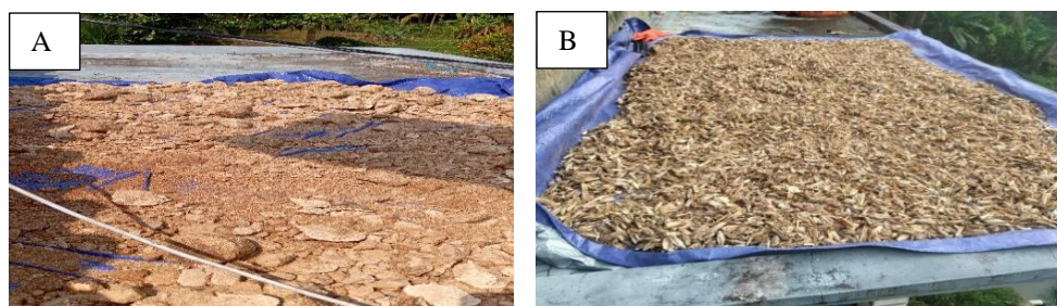
Gambar 2. (A) Limbah baglog jamur, (B) Cangkang udang