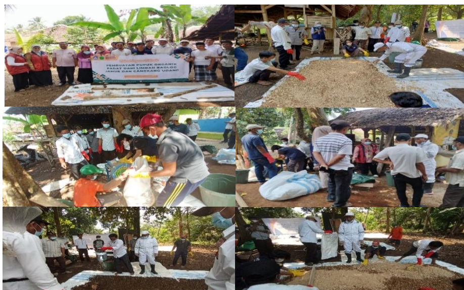
Gambar 4. Praktek pembuatan pupuk organik padat