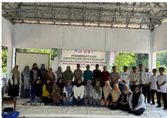
Gambar 4. Pelatihan paket wisata wellness tourism