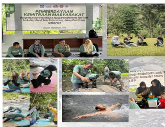
Gambar 5. Pelatihan yoga, forest bathing , dan silanglang hydrotherapy