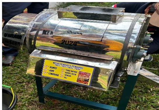
Gambar 1. Alat pencucian, pengupasan dan pemotongan rempah