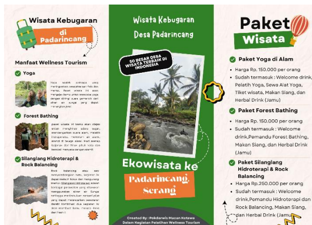
Gambar 7. Paket wisata wellness tourism

Melakukan evaluasi berkala terhadap dampak program pemberdayaan dengan melibatkan partisipasi masyarakat dalam proses evaluasi. Keberlanjutan program paket wisata wellness tourism di Desa Wisata sangat penting untuk menjaga keseimbangan antara kebutuhan wisatawan, pelestarian lingkungan, dan kesejahteraan masyarakat lokal. Beberapa aspek yang perlu diperhatikan untuk memastikan keberlanjutan program ini: