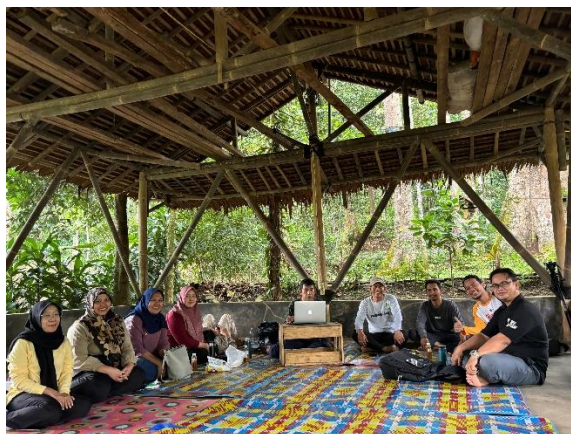
Gambar 2. Identifikasi potensi desa wisata bersama 4 dosen dan 5 anggota pokdarwis macan ketawa

Kegiatan identifikasi potensi wilayah dilakukan secara survei dan wawancara kepada pokdarwis Macan Ketawa, masyarakat setempat dan wisatawan untuk memahami apa yang menjadi daya tarik utama serta pengembangannya Desa Wisata Padarincang, serta kendala yang dihadapi dalam pengembangan wisata.