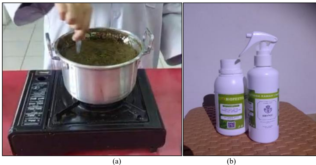
Gambar 1. (a) Proses pembuatan biopestisida (b) produk biopestisida

Bahan baku berupa limbah puntung rokok yang diambil tembakaunya dan daun kelor yang sudah dipisahkan dari tangkainya dijemur hingga mengering. Setelah kering bahan baku dihaluskan menggunakan blender hingga diperoleh bentuk bubuk. Timbang masing-masing bahan baku sebanyak 100gram dan rebus bersamaan dengan 1,6 liter air mendidih hingga terjadi perubahan warna yang menandakan terjadinya proses ekstraksi (Steud dkk., 2023). Hasil rebusan didiamkan selama 5 hari dalam tempat tertutup yang terhindar dari paparan matahari langsung. Setelah 5 hari cairan disaring dari endapannya menggunakan kain saring sehingga diperoleh cairan biopestisida.