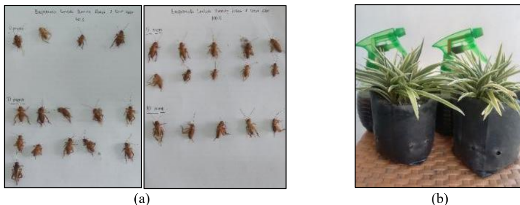
Gambar 5. (a) Hasil pengujian biopestisida 50% dan 100% pada jangkrik (b) Hasil pengujian biopestisida 50% dan 100% pada tanaman hias.

10 menit, jumlah jangkrik yang mati meningkat 11 ekor menjadi 15 ekor untuk biopestisida 50% dan meningkat 5 ekor menjadi 15 ekor untuk larutan 100%. Selain itu, pengujian pada tanaman menunjukkan bahwa biopestisida ini aman bagi pertumbuhan tanaman, tanpa menimbulkan efek samping negatif dan bahkan mampu mendorong pertumbuhan lebih baik dibandingkan tanaman yang tidak diberikan perlakuan.