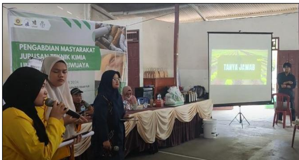
Gambar 4. Penyampaian materi dan tanya jawab

Kegiatan pengabdian kepada masyarakat disampaikan oleh tim dosen dan mahasiswa Universitas Sriwijaya kepada masyarakat Desa pulau Semambu, Indralaya Utara, Ogan Ilir, Sumatera Selatan. Kegiatan dimulai dengan penyampaian materi (Gambar 4) sembari menampilkan video demonstrasi pembuatan produk biopestisida dari tim pengabdian, kemudian dilanjutkan pengisian kuesioner oleh masyarakat desa dan diakhiri dengan foto bersama (Gambar 5). Hal ini dilakukan karena masih banyak masyarakat yang menggunakan pestisida kimia dan mengesampingkan pentingnya menjaga kelestarian lingkungan, tak hanya itu masyarakat juga banyak yang merokok dan membuang puntung rokoknya tanpa dimanfaatkan.