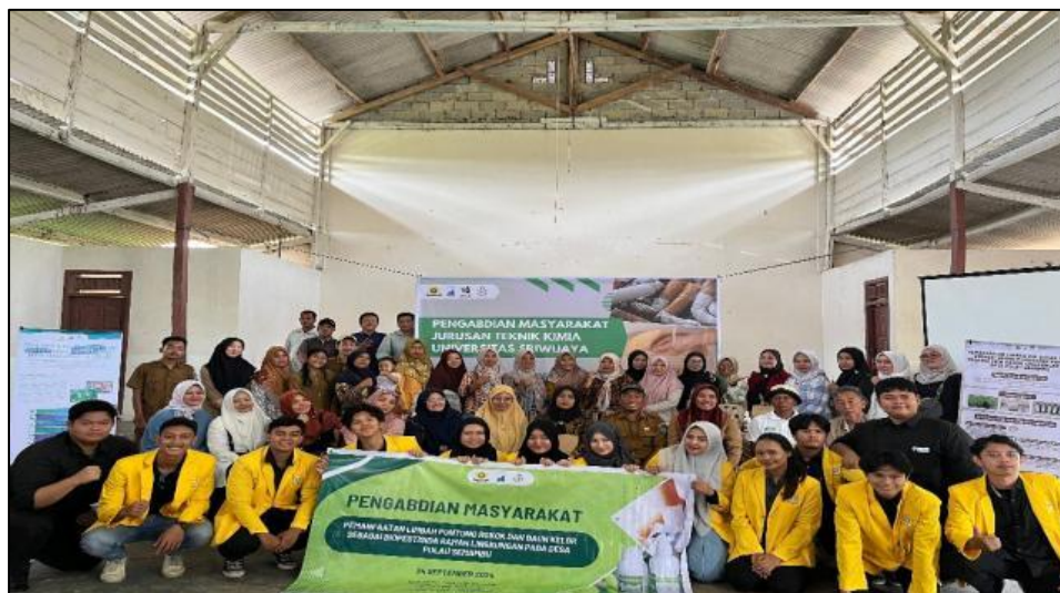
Gambar 5. Foto bersama tim pengabdian dan masyarakat