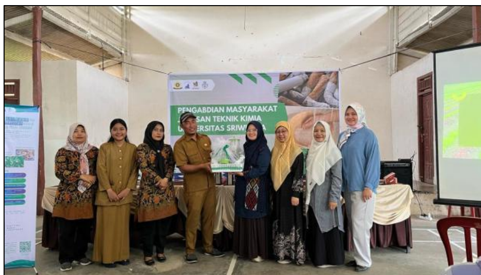
Gambar 3. Penyerahan satu set perlengkapan pembuatan biopestisida

Pengabdian ini dilaksanakan dalam bentuk pelatihan kepada masyarakat, berupa pendampingan dan bimbingan dalam pembuatan biopestisida dari limbah puntung rokok dan daun kelor di Desa Pulau Semambu. Dalam kegiatan ini, sekelompok mahasiswa turut berperan aktif dalam membimbing masyarakat selama proses produksi biopestisida berbahan limbah. Proses pembuatan biopestisida didemonstrasikan melalui pemutaran video yang dilengkapi dengan presentasi materi, guna memudahkan pemahaman peserta terhadap teori dan praktik pengolahan limbah menjadi biopestisida. Setelah seluruh materi, acara dilanjutkan dengan pemberian cinderamata, satu set peralatan pembuatan biopestisida dan hadiah kepada peserta yang telah berpartisipasi secara aktif hingga akhir kegiatan. Langkah ini bertujuan untuk meningkatkan motivasi peserta dalam memanfaatkan limbah puntung rokok dan daun kelor sebagai biopestisida secara mandiri.