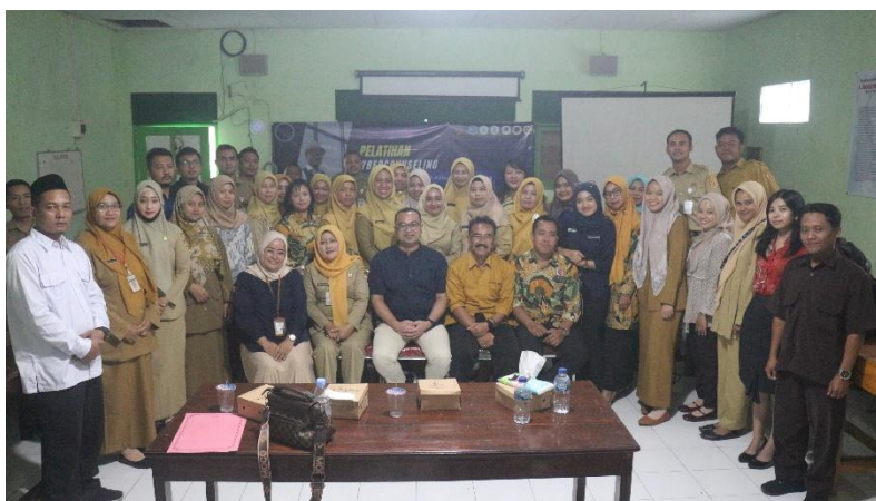
Gambar 1. Peserta pelatihan cybercounseling

Riset pengabdian kepada masyarakat ini dilaksanakan melalui Pelatihan Cybercounseling . Partisipan dalam pelatihan ini adalah Guru Bimbingan dan Konseling (BK)/ Konselor yang tergabung dalam Musyawarah Guru Bimbingan dan Konseling SMK Kabupaten Semarang. Lokasi pelatihan berada di SMK Islam Sudirman 1 Ambarawa, Kabupaten Semarang, Jawa Tengah. Pelatihan dilaksanakan selama 2 hari dari 29-30 Juli 2024. Seluruh peserta yang mengikuti pelatihan sebanyak 39 merupakan Guru BK/Konselor sekolah negeri maupun swasta yang tergabung dalam MGBK SMK Kabupaten Semarang (Gambar 1).