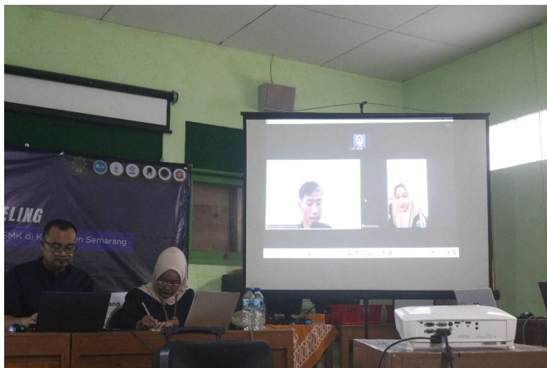
Gambar 4. Simulasi cybercounseling

Data dianalisis dan disajikan dalam data kualitatif dan kuantitatif untuk melihat perubahan yang terjadi sebelum dan sesudah diberikan pelatihan. Data kualitatif memaparkan data hasil wawancara berupa perubahan keterampilan konselor dalam melakukan cybercounseling . Data kuantitatif memaparkan hasil perubahan pengetahuan yang diketahui melalui kuesioner.