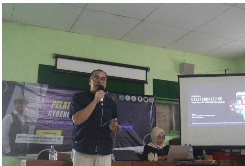
Gambar 3. Penjelasan materi cybercounseling