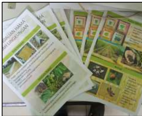
Gambar 3. Selebaran yang Berisi Materi Kegiatan Sosialisasi Terkait Pengendalian Hama Ramah Lingkungan

Dari kegiatan yang dilaksanakan, terlihat bahwa petani di wilayah Tanjung Selor membudidayakan berbagai komoditi pangan, hortikultura dan perkebunan. Secara umum, petani yang berada di satu desa cenderung membudidayakan komoditi yang sama. Komoditi hortikultura yang ditemui yakni semangka, kacang panjang, bayam, rambutan. Komoditi perkebunan yang ditemui yakni kelapa sawit dan kakao. Sementara untuk komoditi pangan, petani mayoritas membudidayakan padi dan