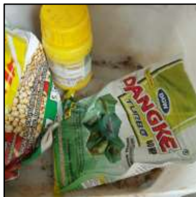
Gambar 5. Insektisida Berbahan Aktif Metomil yang digunakan oleh Petani di Daerah Tanjung Selor

Hasil penelitian Nurzaman et al. (2013) menunjukkan bahwa ketidakbijakan aplikasi insektisida kimia sintetik akan berdampak pada polusi di lingkungan, rendahnya produktivitas, intoksikasi pada hewan bahkan manusia. Firmansyah (2016) menambahkan resistensi dan resurgensi sebagai dampak negatif dari aplikasi insektisida yang tidak bijaksana. Nurcahyo (2017) melengkapi dampak negatif dari insektisida