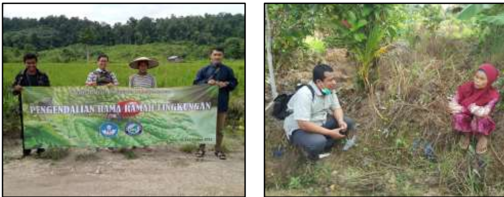
Gambar 2. Kegiatan Sosialisasi dengan Mengunjungi Petani secara Langsung di Lahannya untuk Memberikan Materi Terkait Pengendalian Hama Ramah Lingkungan.

dengan manipulasi faktor-faktor fisik lingkungan sekitar pertanaman seperti penggenangan, pengasapan, pembakaran terbatas. Pengendalian mekanik adalah pengendalian dengan menggunakan bantuan alat seperti pitfall trap , yellow pan trap , dan sweeping net . Pengendalian biologi adalah pengendalian dengan menggunakan bantuan makhluk hidup lain dari jenis predator, parasitoid dan entomopatogen. Yang terakhir namun yang paling dasar dalam kegiatan budidaya adalah pengendalian kultur teknis dengan melalui metode pemilihan benih yang sesuai dengan hama endemic, pengolahan lahan menggunakan teknik pengolahan satu dan dua, penggunaan pupuk berimbang, penggunaan mulsa, pengaturan jarak tanam dan masih banyak lagi. Teknologi pengendalian hama ramah lingkungan dibuat dalam bentuk selebaran seperti pada Gambar 3 yang diberikan pada petani dengan tujuan agar petani dapat selalu mengingat dan mempraktekkan pengendalian ini.