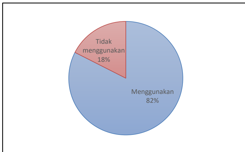
Gambar 4. Persentase Penggunaan Insektisida oleh Petani di Wilayah Tanjung Selor

Hasil survey yang menunjukkan bahwa > 80% petani di wilayah Tanjung Selor masih menggunakan insektisida kimia sintetik (Gambar 4). Pada Gambar 5 terlihat salah satu insektisida berbahan aktif metomil yang digunakan petani di wilayah Tanjung Selor. Meskipun begitu, para petani menggunakan konsentrasi, dosis dan interval aplikasi yang berbeda-beda. Perbedaan ini disebabkan karena komoditi yang dibudidayakan berbeda, pengalaman Bertani yang berbeda, pengalaman pelatihan yang berbeda dan pemahaman tentang berbagai teknologi pengendalian hama juga berbeda. Charina et al. (2018) menambahkan bahwa pengambilan keputusan oleh petani dipengaruhi oleh derajat pendidikan petani, keaktifan petani dalam kegiatan penyuluhan serta persepsi petani terhadap laba relatif.