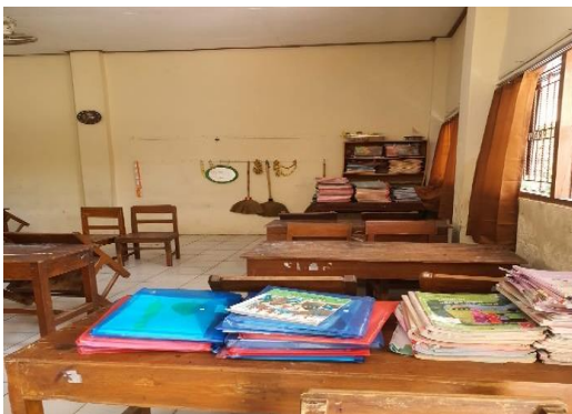
Gambar 1. Kondisi Sudut Baca di Kelas 3

Kesuksesan peserta didik dalam mencapai keterampilan menulis, erat kaitannya dengan dukungan guru dalam memilih dan menerapkan strategi menulis yang tepat, sesuai dengan kebutuhan dan kemampuan peserta didik. Ada beberapa strategi yang dapat diterapkan guru dalam pembelajaran menulis, yaitu strategi pemodelan menulis, menulis bersama, menulis interaktif, menulis terbimbing, dan menulis mandiri (Rosmaini et al., 2018).