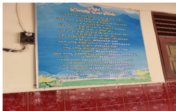
Gambar 3. Poster di Koridor Sekolah

Gambar tersebut menunjukkan adanya program GLS yang sudah dilaksanakan oleh sekolah, yaitu adanya sudut baca di setiap kelas. Namun, belum optimal dalam penataannya. Serta Gambar 3 menunjukkan adanya mading di setiap kelas yang terletak di papan tulis belakang.