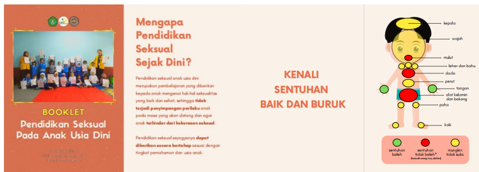
Gambar 5. Tampilan booklet kegiatan

Pada kegiatan ini juga diberikan booklet kepada orangtua dan guru. Materi yang disajikan dalam booklet yaitu terkait penerapan pendidikan seksual di rumah, upaya perlindungan diri bagi anak, dan pemetaan tubuh untuk sentuhan boleh dan tidak boleh. Booklet ini diberikan sebagai media penunjang pembelajaran pendidikan seksual anak usia dini.