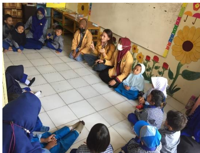
Gambar 1. Pendekatan sasaran

Tahap pelaksanaan program ini diawali dengan melakukan pendekatan kepada peserta didik di TK Bina Ana Prasa III Kota Samarinda. Hal ini dilakukan untuk menumbuhkan kedekatan antara pemateri dan peserta didik yang diharapkan akan memudahkan penyuluhan. Kegiatan ini dilakukan sebanyak tiga kali pertemuan sebelum pelaksanaan penyuluhan.