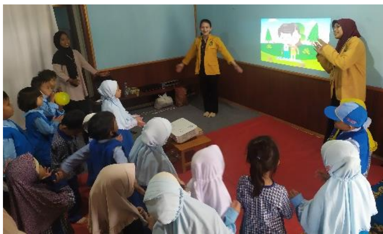
Gambar 2. Penyampaian materi

Pada pelaksanaan kegiatan penyuluhan dan edukasi pendidikan seksual berlangsung dalam beberapa tahapan kegiatan yaitu pembukaan, penyampaian materi, evaluasi, dan penutup. Jumlah peserta dalam kegiatan ini sebanyak 20 peserta didik TK Bina Ana Prasa III. Pada tahap penyampaian materi dilakukan dengan bantuan media audio-visual dengan judul “Ku Jaga Diriku” dengan materi yang disampaikan adalah sentuhan boleh dan sentuhan tidak boleh serta langkah perlindungan diri pada anak dari orang asing. Pada penyampaian materi ini, peserta didik menyanyi dan bergerak bersama sesuai dengan video yang diputarkan beberapa kali.