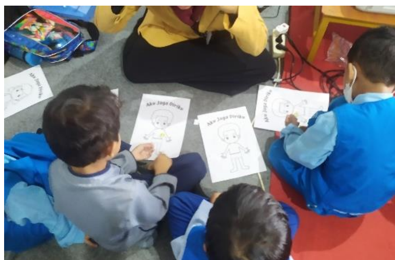
Gambar 3. Kegiatan pendampingan body mapping

Kegiatan evaluasi dilakukan dengan metode pendampingan body mapping sederhana. Setelah pemutaran video, dibagikan selebaran kertas berisi sketsa gambar tubuh manusia beserta stiker benar dan salah. Peserta didik dibentuk menjadi beberapa kelompok kecil sebanyak 4 kelompok kecil. Masing-masing kelompok didampingi oleh seorang guru atau tim pelaksana kegiatan. Peserta didik diminta untuk menempelkan stiker benar pada bagian tubuh yang boleh disentuh (sentuhan baik) dan menempelkan stiker salah pada bagian tubuh yang tidak boleh disentuh (sentuhan buruk).