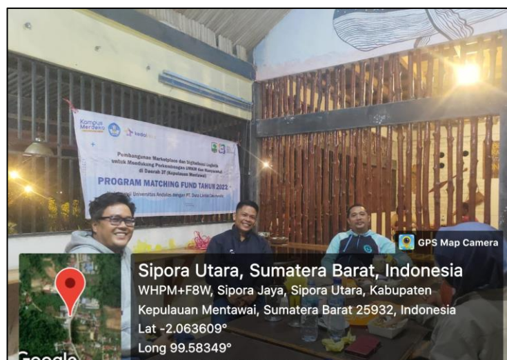
Gambar 3. Diskusi dengan salah satu UMKM potensial

Sesuai dengan perencanaan, maka kegiatan berikutnya yang dilakukan adalah menemui beberapa pelaku UMKM setempat. Diskusi secara personal dengan beberapa UMKM potensial di Mentawai memberikan informasi-informasi detil terkait kondisi yang dialami UMKM saat ini. UMKM yang diundang adalah UMKM yang memiliki produk ukiran khas Mentawai serta UMKM yang menjual hasil alam.