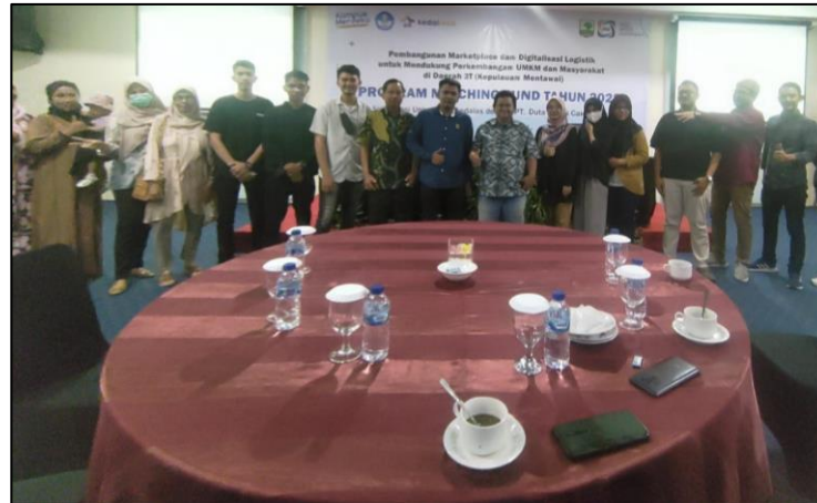
Gambar 6. Foto bersama saat penutupan acara hari pertama

Media yang digunakan sebagai platform pendukung digitalisasi UMKM pada kegiatan ini adalah aplikasi “Bulagat”. Bulagat merupakan sebuah marketplace yang dibuat untuk memfasilitasi UMKM di wilayah Kepulauan Mentawai. Berikut tampilan aplikasinya.