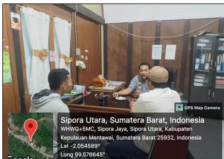
Gambar 2. Kunjungan ke kantor Disperindagkop UMKM Mentawai

Kegiatan sosialisasi dan pendampingan digitalisasi UMKM ini diawali dengan mendatangi Dinas Perindustrian, Perdagangan, Koperasi, dan UMKM (Disperindagkop UMKM) Kabupaten Mentawai. Tujuan kunjungan tersebut adalah untuk meminta izin melakukan kegiatan serta meminta kerja sama Disperindagkop UMKM sebagai bentuk dukungan pemerintah daerah. Disperindagkop UMKM menyambut baik upaya ini dan bersedia membantu pelaksanaan kegiatan ini.