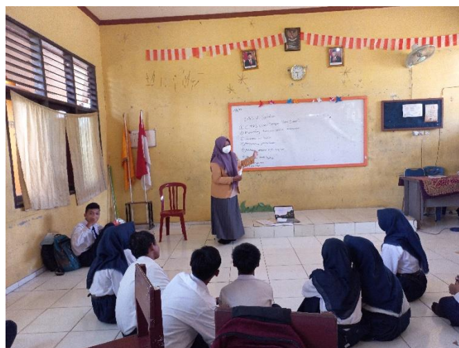
Gambar 2. Penyuluhan PHBS di sekolah pada kader kesehatan remaja

SMPN 39 Samarinda dijadikan lokasi penyuluhan berdasarkan rekomendasi PJ Program UKS Puskesmas Air Putih. Hal ini dilatarbelakangi dari cakupan pelaksanaan PHBS di Sekolah yang masih rendah pada sekolah tersebut, meliputi belum adanya KTR (Kawasan Tanpa Rokok), kondisi toilet dan jamban belum memadai, belum adanya kantin sehat, serta tidak dilakukan pemantauan berat badan dan tinggi badan pada siswa dan siswi secara berkala. Sekolah memiliki peran untuk bertanggung jawab dalam pelaksanaan PHBS (Supriyatno et al., 2021). Dibandingkan sekolah lain, SMPN 39 Samarinda memiliki jarak tempuh yang jauh dari lokasi Puskesmas Air Putih dan jauh dari pusat kota. Hal ini juga yang menyebabkan minimnya dilaksanakan edukasi atau penyuluhan kesehatan di SMPN 39 Samarinda oleh tenaga kesehatan, terutama mengenai PHBS di Sekolah. Pada SMPN 39 Samarinda juga telah memiliki Kader Kesehatan Remaja yang dibentuk oleh Pembina UKS. Kader kesehatan remaja tersebut memiliki kemauan untuk meningkatkan kesehatan sekolah. Namun, edukasi pada Kader Kesehatan Remaja belum dilakukan dengan maksimal. Pelaksanaan program penyuluhan PHBS (Perilaku Hidup Bersih dan Sehat) di Sekolah dilakukan di ruang kelas SMPN 39 Samarinda pada hari Selasa tanggal 6 Desember 2022.