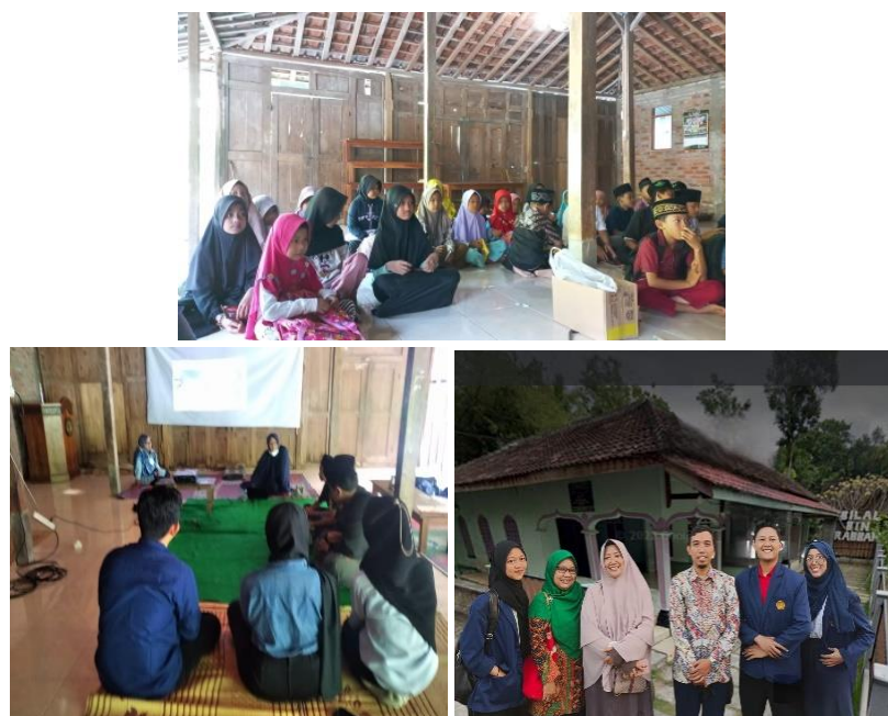
Gambar 2. Foto kegiatan pelatihan, pendampingan, dan implementasi technology information untuk remaja masjid Bilal Bin Robbah

Berikut ini diberikan beberapa foto selama proses kegiatan pengabdian berlangsung, yaitu mulai dari pelatihan, pendampingan dan implementasi penggunaan media pembelajaran yang dihasilkan.