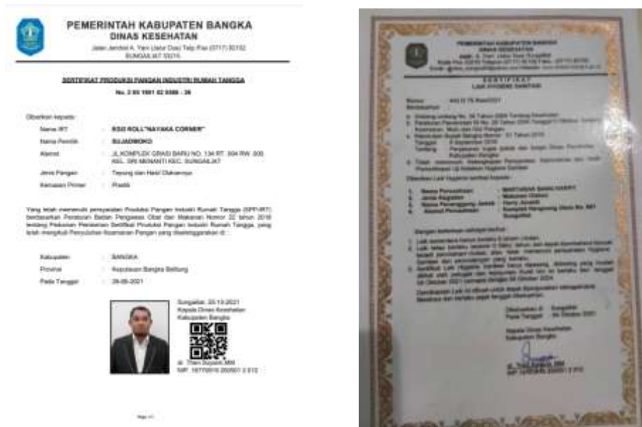
(a) (b) Gambar 4. (a) Sertifikat PIRT Produk UMKM Egg Roll Sujadmoko, (b) Sertifikat Laik HS Martabak Harry.