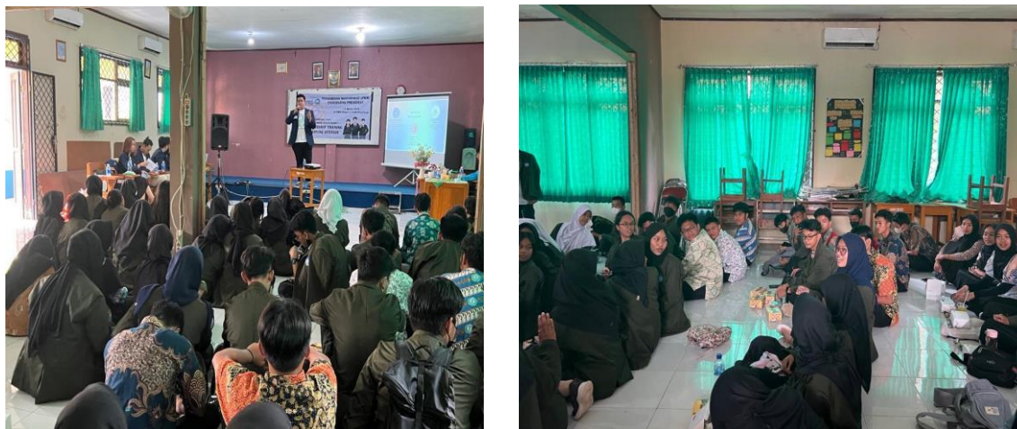
Gambar 3. Pengurus OSIS mengikuti pelatihan leadership

Mereka sangat aktif dan tidak canggung-canggung untuk berinteraksi satu sama lain, baik dengan sesama peserta maupun dengan pembicara saat berlangsungnya kegiatan. Dalam kegiatan tersebut, mahasiswa President University juga turut aktif dengan menyampaikan bagaimana pengalamannya ketika menjadi pengurus OSIS waktu di SMA maupun saat di perguruan tinggi. Pengalaman yang kemudian memotivasi semangat para peserta hingga tips and trick menghadapi siswa siswi kurang disiplin dalam mengikuti peraturan sekolah. Penggunaan media social dapat digunakan untuk memperkenalkan model kepemimpinan melalui penyampaian informasi bagi anggota maupun khalayak ramai (Mukhlis, 2016).