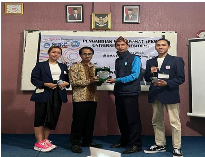
Gambar 4. Penyerahan plakat