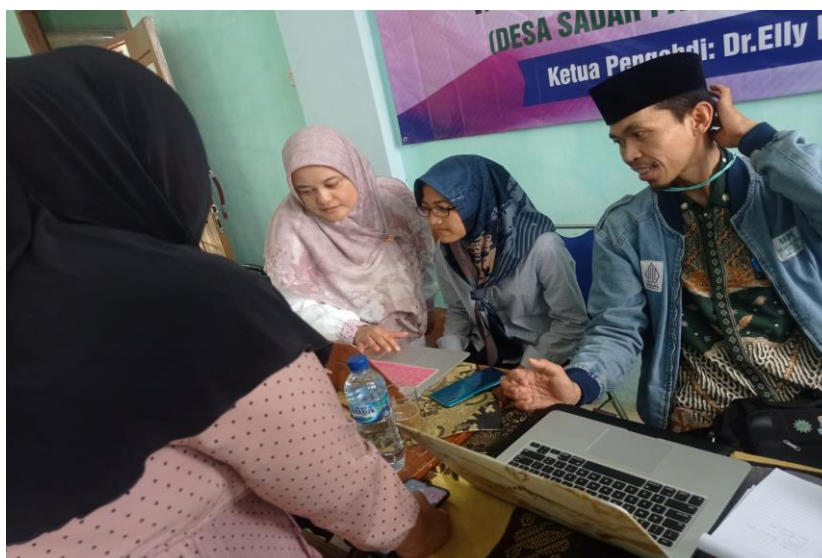
Gambar 1. Kegiatan pendataan produk UMKM bersama pendamping

pemasaran karena menggunakan media sosial sebagai marketplace . Akhirnya, produk UMKM tidak hanya berorientasi lokal tetapi bisa menaikan skala ke level nasional maupun internasional. Pemasaran digital akan meningkatkan kepercayaan konsumen manakala telah tersertifikasi halal. Sebab konsumen yang bukan berasal dari wilayah dimana produk olahan makanan diproduksi, tidak memiliki informasi yang cukup tentang proses pembuatan makanan. Oleh karena itu, penting untuk memberikan pelatihan kepada pelaku UMKM tentang digital marketing produk UMKM.