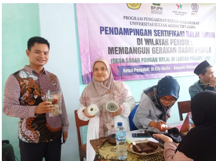
Gambar 2. Produk UMKM yang didaftarkan sertifikasi halal