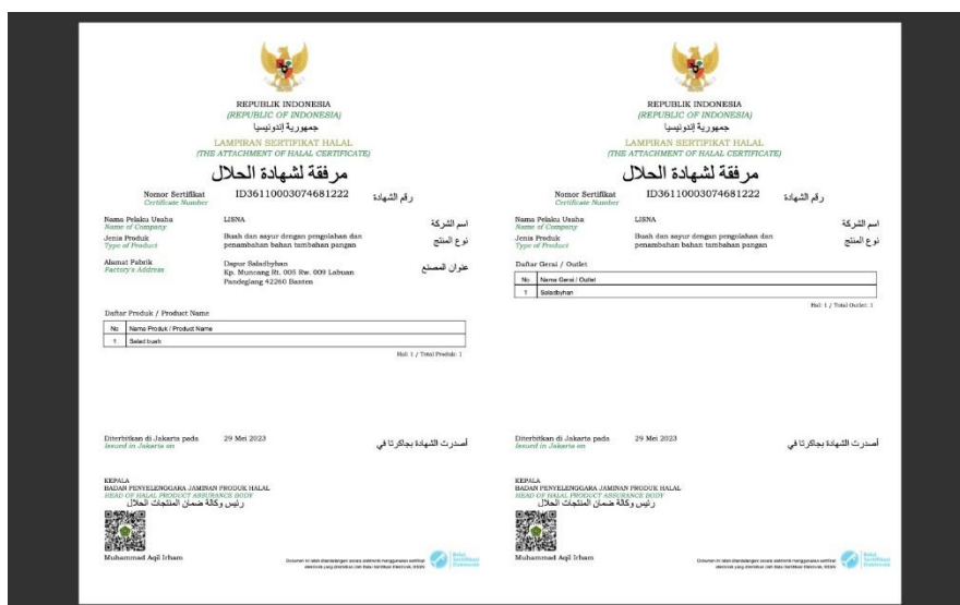
Gambar 7. Sertifikat Halal salah satu UMKM

Contoh NIB (No Induk berusaha) UMKM yang dalam prodrd sertifikasi melalui aplikasi sihalal