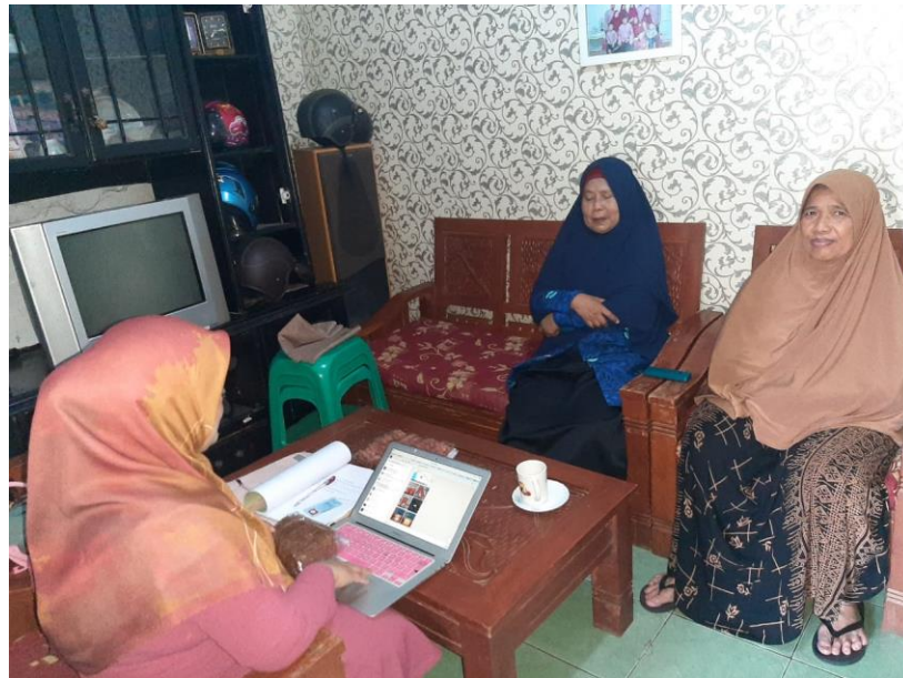
Gambar 5. Kegiatan proses sertifikasi dengan mendatangi lokasi

Contoh makanan UMKM di Desa Labuan yang dalam proses sertifikasi