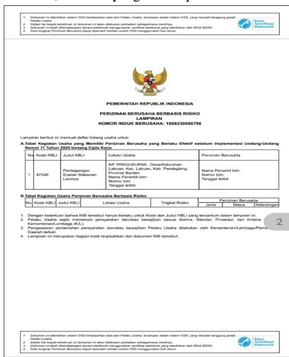
Gambar 8. NIB UMKM yang telah terbit

Contoh NIB (No Induk berusaha) UMKM yang dalam prodrd sertifikasi melalui aplikasi sihalal