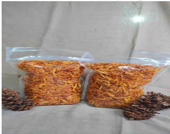
Gambar 6. Contoh makanan yang sedang disertifikasi, kentang Mustafa

Contoh makanan UMKM di Desa Labuan yang dalam proses sertifikasi