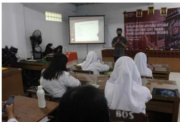
Gambar 3. Pemaparan materi oleh narasumber

Setiap peserta berpartisipasi dalam mempraktikkan beberapa fitur yang ada di dalam Google Translate dengan dipandu oleh pemateri. Pada sesi pertama, para peserta dipandu untuk menggunakan fitur penerjemahan pada Google Translate dalam hal Translation , Word Class , dan Synonym . Pada sesi kedua, para peserta dipandu untuk menggunakan fitur speaker pada Google Translate dalam hal Listening Practice , Pronunciation Practice , Reading Aloud dan Audio Translation . Pada sesi terakhir, para peserta dipandu menggunakan fitur kamera yang tersedia dalam Google Translate untuk mempraktikkan Translation with Camera .