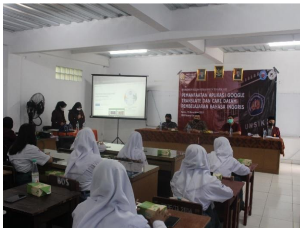
Gambar 1. Kepala sekolah, guru, dan siswa menghadiri acara

Kegiatan pelatihan ini dilaksanakan di SMK Rosma Karawang, Jawa Barat dengan dihadiri peserta dari 30 orang siswa, 2 guru bahasa Inggris, dan dihadiri oleh Kepala Sekolah untuk membuka acara. Adapun rincian hasil kegiatan pengabdian ini adalah sebagai berikut.