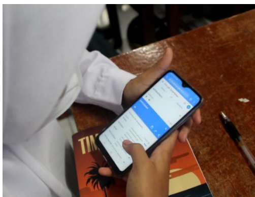
Gambar 4. Aktifitas salah seorang peserta menggunakan google translate

pemateri, dan jika peserta mampu mengucapkannya dengan baik, maka kalimatnya akan muncul. Ini sekaligus melatih siswa bagaimana mengucapkan kalimat dalam bahasa Inggris dengan baik. Dalam Audio Translation , para peserta bisa menggunakan fitur mikrofon tersebut untuk menerjemahkan bahasa target secara lisan. Sedangkan pada materi Translation with Camera , peserta bisa menggunakan tombol kamera pada aplikasi tersebut untuk menerjemahkan teks tertulis pada berbagai media, seperti buku dll.