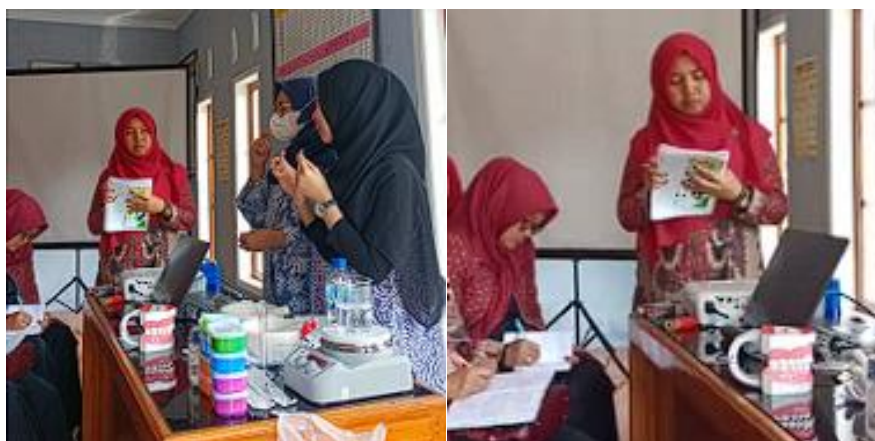
Gambar 3. Demonstrasi pembuatan pasta gigi

Hasil analisis data dari umur, jenis kelamin dan tingkat Pendidikan yang mengikuti kegiatan, semuanya perempuan, usia produktif dan tingkat Pendidikan dari SD sampai dengan tingkat SMU dan SMK.