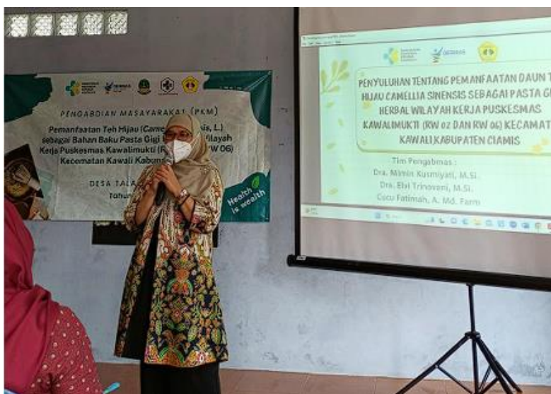
Gambar 1. Penyuluhan pengabdian Masyarakat

Penduduk Desa Talagasari dan Sindangsari Kecamatan Kawali Kabupaten Ciamis sebagian besar bekerja pada sektor pertanian terutama teh hijau. Pengolahan teh hijau di daerah ini masih dilakukan secara tradisional dan penggunaannya hanya untuk dikonsumsi secara diminum pada pagi, siang dan malam hari. Banyak yang belum mengetahui bahwa teh hijau memiliki manfaat untuk kesehatan, sehingga dilakukan penyuluhan dan demonstrasi terkait manfaat teh hijau terutama sebagai pasta gigi.