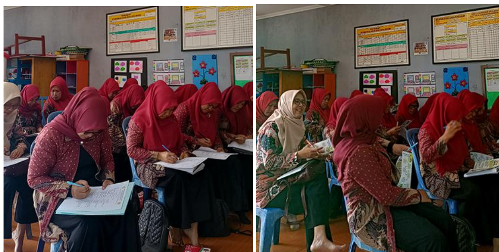
Gambar 2. (a) Pre-test dan Post-test, (b) Penyebaran leaflet

dibagi ke dalam 3 sesi yang pertama yaitu cara pembuatan serbuk teh hijau, pembuatan pasta gigi teh hijau dan pengemasan pasta gigi