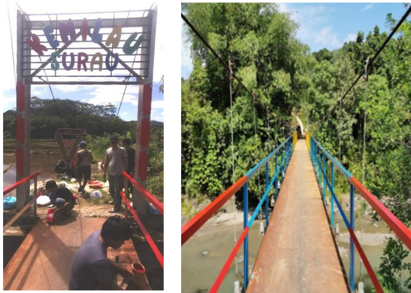
Gambar 2. Hasil gotong royong pemasangan ikon dan pengecatan jembatan gantung