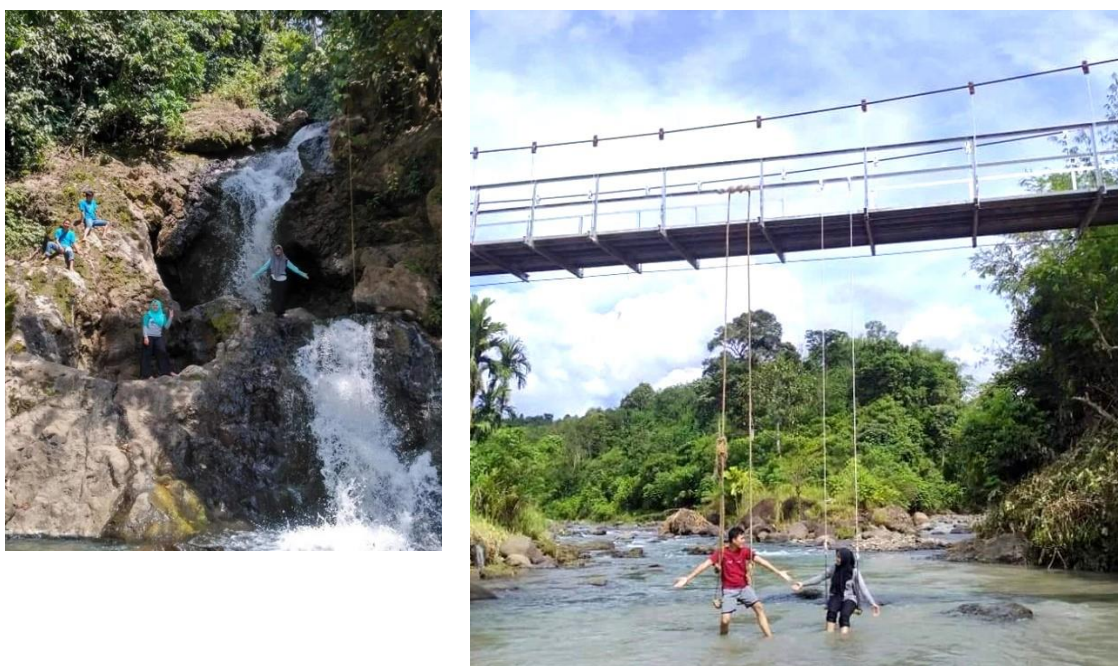
Gambar 4. Promosi di Instagram https://www.instagram.com/wisata_desa_surau/

Desa wisata dikembangkan dengan pertimbangan yang matang terkait berbagai aspek. Masyarakat memiliki pemahaman yang baik tentang desa wisata dan adanya potensi lokal yang dapat dikembangkan untuk kegiatan wisata. Pada dasarnya pengembangan pariwisata di Desa Surau adalah pariwisata berkelanjutan menitikberatkan pada pengembangan skala kecil dan intensitas rendah. Dalam pengembangannya memiliki semangat pengembangan wisata alternatif yang berskala kecil, memberikan amenity dari masyarakat sekitar, pelaku wisata adalah masyarakat lokal dan memberikan manfaat bagi masyarakat sekitar. dengan tingkat kepadatan yang relatif rendah. Jika dilihat dari karakteristik wisatawan yang berkunjung adalah wisatawan yang peka terhadap lingkungan sekitar dan budaya lokal, ingin memberikan dampak positif pada destinasi, mandiri, mencari tempat wisata yang otentik dan bermakna bagi diri sendiri, dimotivasi oleh keinginan pemenuhan pengalaman dan pembelajaran diri sendiri, kontak langsung dengan masyarakat setempat, dan mencari petualangan yang menantang secara fisik dan mental (Arismayanti et al., 2019).