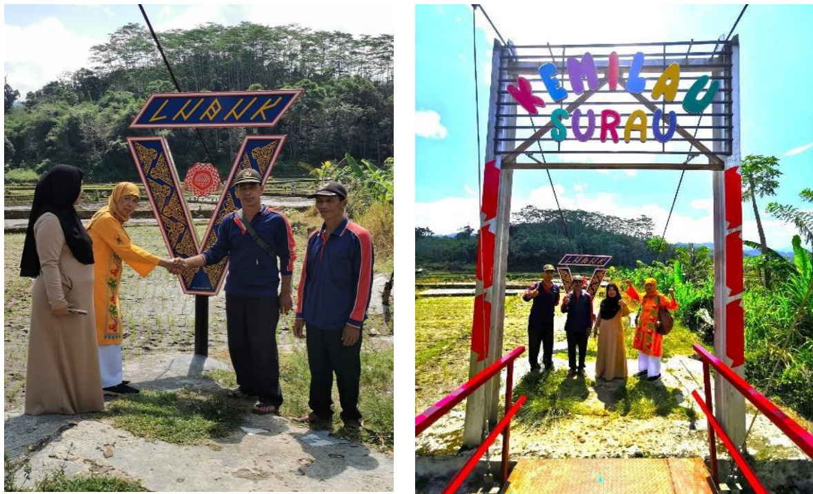
Gambar 3. Serah terima hibah ikon LUBUK Vi