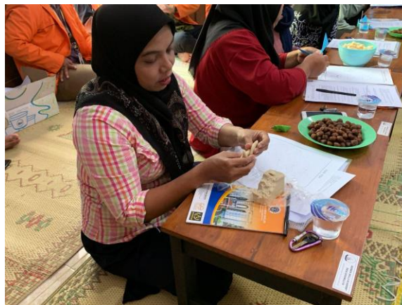
Gambar 3. Praktik sederhana permainan dengan media plastisin

Hasil pretest dan postest yang telah diisi peserta menunjukkan bahwa pendampingan anak menggunakan metode montesori dapat membuat anak-anak merasa tertarik dalam menerima pelajaran atau keterampilan tertentu. Kegiatan pendampingan ini juga dilakukan dengan praktik sederhana permainan menggunakan media seperti plastisin dan origami yang disarankan dalam Metode Montessori (Gambar 3). Metode Montessori sangat berperan untuk membangun dan mengembangkan jiwa kemandirian anak serta peningkatan keterampilan motorik. Bermain menggunakan media seperti plastisin pada anak memiliki manfaat seperti dapat mengkoordinasikan jari-jari tangan, melenturkan otot-otot jari tangan, melatih keuletan dan kesabaran serta mengembangkan imajinasi dan kreativitas anak (Kartini & Sujarwo, 2014).