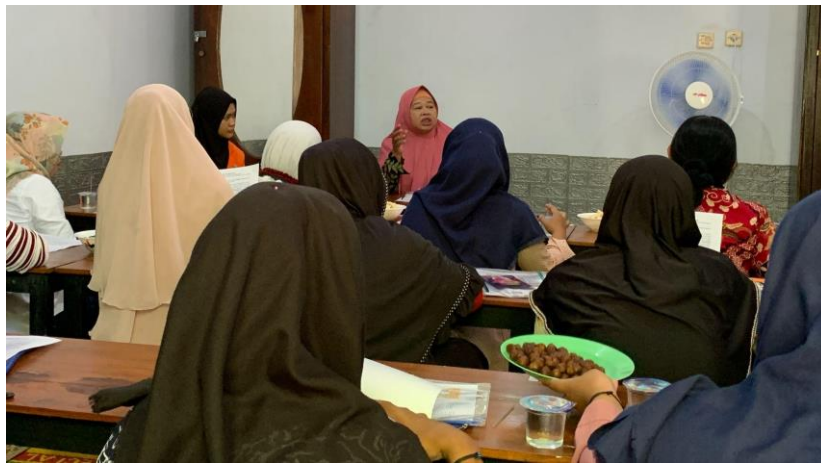
Gambar 1. Kegiatan pendampingan metode montessori kepada anggota WSA

Pendampingan Metode Montessori untuk Anak kepada Anggota Women Skills Academy (WSA) di Desa Sidomulyo, Bantul dilakukan dengan memberikan penyuluhan kepada anggota WSA yang berusia 15-45 tahun berupa pendidikan non-formal dengan pemaparan materi secara ceramah dan dilakukan sesi diskusi (Gambar 1). Kegiatan ini dilaksanakan pada hari minggu 23 juli 2023 di Pedukuhan Cangkring Desa Sidomulyo Kabupaten Bantul.