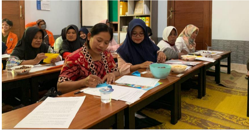
Gambar 4. Praktik sederhana permainan dengan media origami

kecermatan dalam gerakannya serta meningkatkan keterampilan anak dalam menggunakan jari-jemarinya dalam aktivitas kehidupan sehari-hari (Sum dkk., 2021).