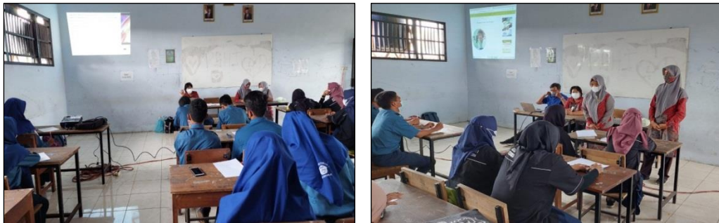
Gambar 2. Penyampaian materi dalam kegiatan pelatihan

Kegiatan evaluasi dilakukan untuk mengetahui tingkat keberhasilan dari kegiatan pelatihan yang telah dilaksanakan oleh tim pengabdian. Dasar yang digunakan untuk melaksanakan kegiatan evaluasi adalah hasil tes, baik pre-test maupun post-test , yang telah dikerjakan oleh para guru dan siswa SMK Veteran. Kedua hasil tes tersebut selanjutnya dibandingkan untuk mengetahui tingkat perkembangan pengetahuan dan pemahaman para guru dan siswa. Pelaksanaan kegiatan pre-test dilakukan oleh Dr. Mukti Widayati, M.Hum. Sedangkan pelaksanaan kegiatan post-test dilakukan oleh Dr. Benedictus Sudyana, S.Pd., M.Pd. Hasil evaluasi baik dari pre-test maupun post-test selanjutnya digunakan sebagai pertimbangan untuk menentukan keputusan dalam melakukan perbaikan pada kegiatan pelatihan yang selanjutnya. Penyampaian materi dapat dilihat pada Gambar 2.