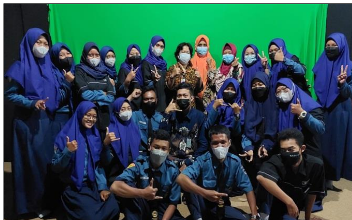
Gambar 4. Foto bersama dengan mitra pelatihan

Berdasarkan hasil pengamatan yang dilakukan oleh tim pengabdian selama melaksanakan kegiatan pelatihan dengan menggunakan lembar observasi, yaitu pada kegiatan penyuluhan dan demonstrasi, dapat diketahui bahwa terjadi peningkatan aktivitas yang dilakukan oleh guru dan siswa SMK Veteran. Keaktifan dan antusias para guru dalam mengikuti kegiatan pelatihan ini terlihat dari semakin meningkatnya peserta pelatihan yang mengajukan pertanyaan kepada tim pengabdian pada saat sesi diskusi. Peserta pelatihan yang bertanya pada sesi demonstrasi terlihat lebih banyak dibandingkan sesi penyuluhan. Hal ini menandakan bahwa peserta pelatihan semakin aktif dan semakin tinggi rasa ingin tahunya. Selama masa pendampingan, peserta pelatihan juga menunjukkan semangat untuk dapat menulis rilis berita online dengan menggunakan Bahasa Indonesia yang baik, benar, dan menarik. Hal tersebut tentu tidak terlepas dari semangat dari para guru dan siswa untuk mengenalkan berbagai keunggulan SMK Veteran Sukoharjo kepada masyarakat publik. Dokumentasi bersama mitra pelatihan dapat dilihat pada Gambar 4.