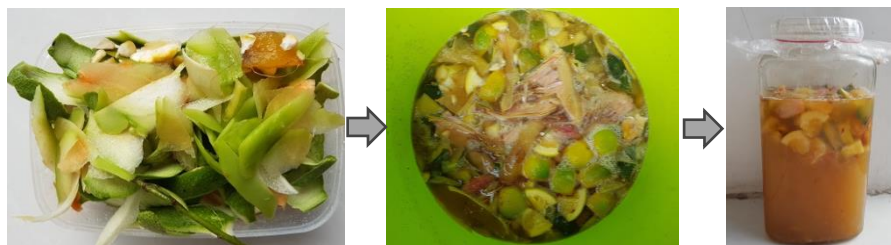
Gambar 1. Pembuatan ecoenzyme berbahan limbah dapur segar oleh peserta

molase cair, kering, gula aren, gula kelapa atau gula lontar. Gula berfungsi sebagai makanan mikroorganisme ketika proses fermentasi sedang berlangsung (Junaidi et al., 2021). Sedangkan air yang digunakan juga bisa beragam, sebagai contoh air sumur, air hujan, air buangan AC, air isi ulang, air PDAM (didiamkan selama 24 jam sehingga kaporit bisa mengendap dan dipisahkan), bergantung pada ketersediaan air yang ada di masyarakat. Untuk penggunaan wadah dalam pembuatan eco-enzyme , disarankan adalah wadah plastik yang memiliki tutup lebar, disarankan untuk tidak menggunakan wadah yang berbahan logam karena mudah karatan atau wadah kaca yang mudah pecah. Penggunaan botol hanya disarankan untuk penyimpanan hasil eco-enzyme , tidak untuk wadah pembuatan karena tutup botol sempit dan rentan meledak.