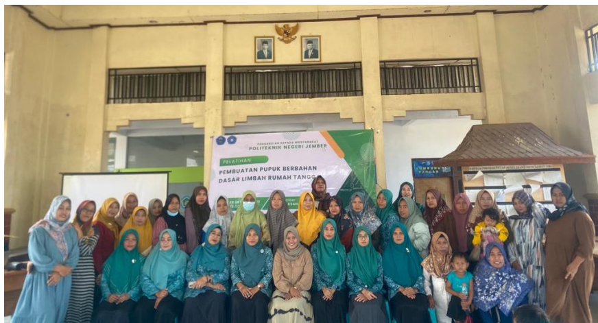
Gambar 4. Dokumentasi pasca kegiatan