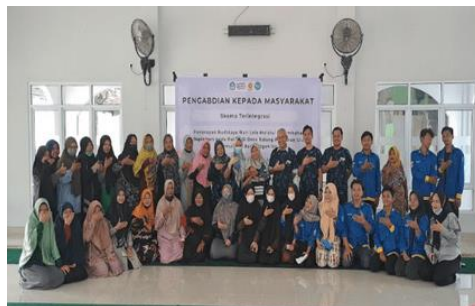
Gambar 8. Foto bersama

Dari hasil post-test terlihat bahwa pemahaman mitra tentang penambahan suplemen pada pakan mengalami peningkatan dibandingkan sebelum dilakukan kegiatan pengabdian. Kegiatan sosialisasi dan pelatihan ini ditutup dengan penyerahan beberapa alat dan bahan dari tim PKM kepada Mitra dan dilanjutkan dengan foto bersama antara tim pengabdian dan peserta. Foto bersama disajikan pada gambar 8.