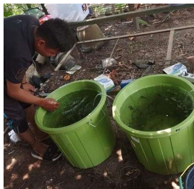
Gambar 9. Pemeliharaan ikan lele

Tahap terakhir dari kegiatan PkM yaitu pendampingan. Pada tahap ini dilakukan secara demonstration plot (demplot) dengan memberikan kesempatan kepada mitra untuk mempraktekkan dalam kegiatan budidaya ikan hias dari materi yang sudah disampaikan pada tahap sosialisasi dan pelatihan dengan didampingi oleh tenaga teknis yaitu mahasiswa sebagai pengelola kegiatan. Kegiatan pendampingan ini dilakukan selama 30 - 60 hari (gambar 9).