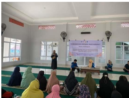
Gambar 4. Penyampaian materi

Sebelum dilakukan penyampaian materi, pembudidaya diminta untuk mengisi kuisisioner ( pre-test ) yang bertujuan untuk mengetahui pemahaman awal pembudidaya tentang budidaya ikan lele. Begitu juga setelah penyampaian materi dan pelatihan, pembudidaya juga diminta mengisi kuisisioner yang sama ( post-test ) untuk mengetahui pemahaman pembudidaya setelah dilakukannya kegiatan sosialisasi dan pelatihan. Penilaian kuisisioner dilakukan berdasarkan Yoto et al. (2018) bahwa dengan menggunakan skor penilaian skala likert yang terdiri dari skor 1 menunjukkan penilaian kurang, skor 2 menunjukkan penilaian cukup dan skor 3 menunjukkan penilaian baik. Hasil kuisisioner pre-test disajikan pada gambar 5.