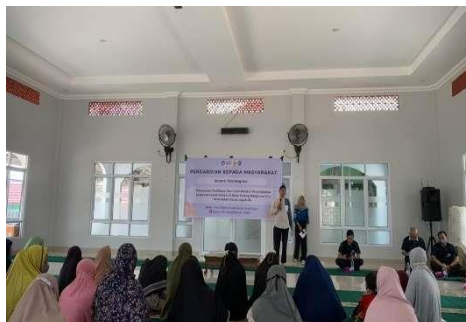
Gambar 3. Sambutan dari ketua mitra

Kegiatan sosialisasi dan pelatihan dilakukan di lokasi mitra yang dihadiri oleh mitra serta tim PkM yang terdiri dari dosen dan mahasiswa Program Studi Budidaya Perairan, Universitas Sriwijaya. Kegiatan sosialisasi dan pelatihan dimulai dengan penyampaian sambutan sekaligus membuka acara oleh ketua mitra (Gambar 3) lalu dilanjutkan dengan penyampaian materi tentang pemberian suplemen pada pakan ikan lele yang merupakan aplikasi berbagai teknologi budidaya yang merupakan pengembangan hasil penelitian dosen Program Studi Budidaya Perairan, Universitas Sriwijaya (Gambar 4).