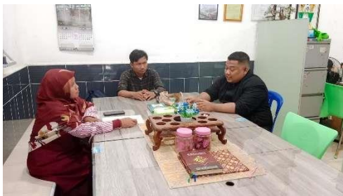
Gambar 2. Koordinasi dengan mitra

Tahap persiapan dimulai dengan koordinasi dan survey tim pengusul kegiatan pengabdian dan mitra serta perangkat desa, persiapan alat dan bahan. Kordinasi dengan mitra bertujuan untuk menanyakan permasalahan yang dihadapi oleh mitra sekaligus meminta kesediaan kerjasama mitra (Gambar 2).