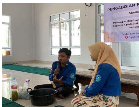
Gambar 6. Pelatihan pemberian suplemen pada pakan

Setelah itu, dilakukan praktek pelatihan pemberian suplemen pada pakan ikan lele disajikan pada gambar 6.