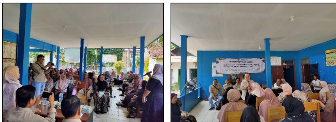
Gambar 1. Kegiatan sosialisasi proses pengajuan sertifikasi produk halal

Acara dimulai dengan pemberian paparan materi dari narasumber mengenai pentingnya sertifikasi Halal pada produk makanan. Adapun poin dari paparan materi sebagai berikut: (1) Dasar hukum sertifikasi Halal; (2) Urgensi sertifikasi Halal; (3) Persyaratan pengajuan sertifikasi Halal; (4) Teknis dan metode pendaftaran sertifikasi Halal; (5) Paparan materi dilakukan dengan metode ceramah dan diskusi. Peserta diberikan keleluasaan untuk bertanya secara langsung kepada narasumber. Pemberian materi kepada peserta menjadi penting mengingat hasil observasi tim pengabdian menunjukkan bahwa masih banyak warga yang belum memahami secara komprehensif mengenai konsep sertifikasi Halal. Padahal proses pengajuan sertifikasi Halal dari jalur self-declare bagi pelaku UMKM skala kecil tidak dikenakan biaya dan menjadi program prioritas pemerintah dalam visi mewujudkan Indonesia sebagai pusat wisata Halal dunia.