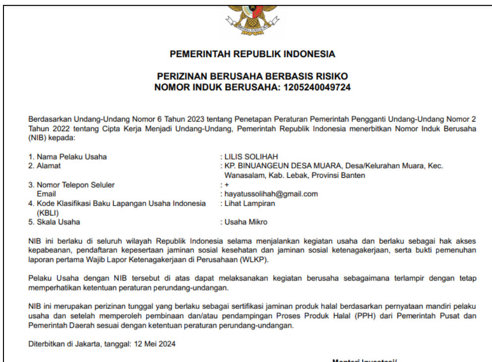
Gambar 3. Nomor induk berusaha milik salah satu peserta pendampingan sertifikasi produk halal