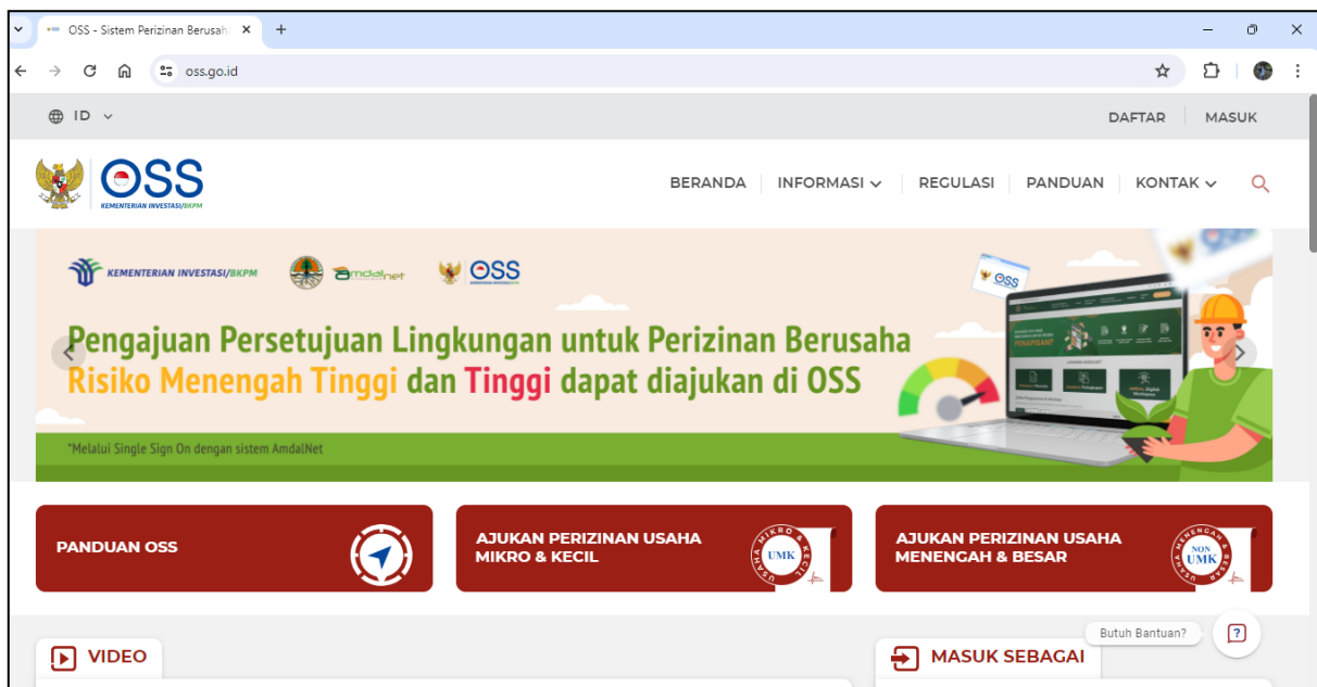
Gambar 2. Tampilan pada laman pembuatan NIB

Tahap ini merupakan langkah pertama yang harus dilakukan oleh pelaku usaha yaitu mendaftarkan usahanya agar tercatat secara legal oleh pemerintah. Hal ini untuk membantu pemerintah dalam mengidentifikasi jumlah dan karakteristik dari pelaku usaha. Pembuatan nomor izin berusaha melalui laman: oss.go.id . Pelaku usaha diharuskan membuat akun dengan mencantumkan nomor telepon dan email yang aktif. Setelah itu, pelaku usaha perlu memberikan informasi yang detail berkenaan dengan identitas dan karakteristik usahanya sesuai dengan yang tertera pada laman tersebut. Berikut tampilannya.