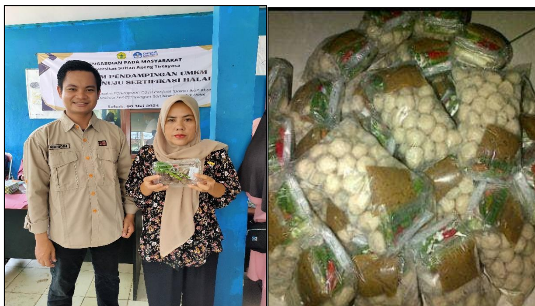
Gambar 5. Pendampingan sertifikasi halal produk bakso ikan

Ketiga langkah tersebut telah didemonstrasikan oleh tim pengabdian sehingga dapat menjadi bekal bagi para pelaku usaha yang mengikuti kegiatan pendampingan untuk dapat melakukan self-declare dalam rangka proses pengajuan sertifikasi produk Halal. Hasil yang ingin dicapai oleh tim pengabdian dari kegiatan pendampingan ini adalah adanya peningkatan pengetahuan dan keterampilan para perempuan pelaku usaha Bakso Ikan Khas Malingping ini dalam melakukan proses pendaftaran sertifikasi produk Halal. Hasil lainnya yang ingin dicapai tentu saja terdapat beberapa bagian dari pelaku usaha yang berhasil mendapatkan sertifikat Halal.